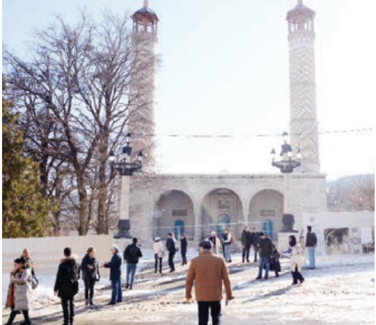
Yanvarın 24-də Bakı-Şuşa reysi ilə hərəkət edən ilk sərnişin avtobusu Şuşa şəhərinə çatıb.