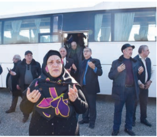
AZƏRTAC xəbər verir ki, saat 06:30-da Bakıdan yola çıxan ilk sərnişin avtobusu Ağdamda çatıb.

Yanvarın 24-də Bakı-Ağdam-Bakı müntəzəm avtobus marşrutu istifadəyə verilib.