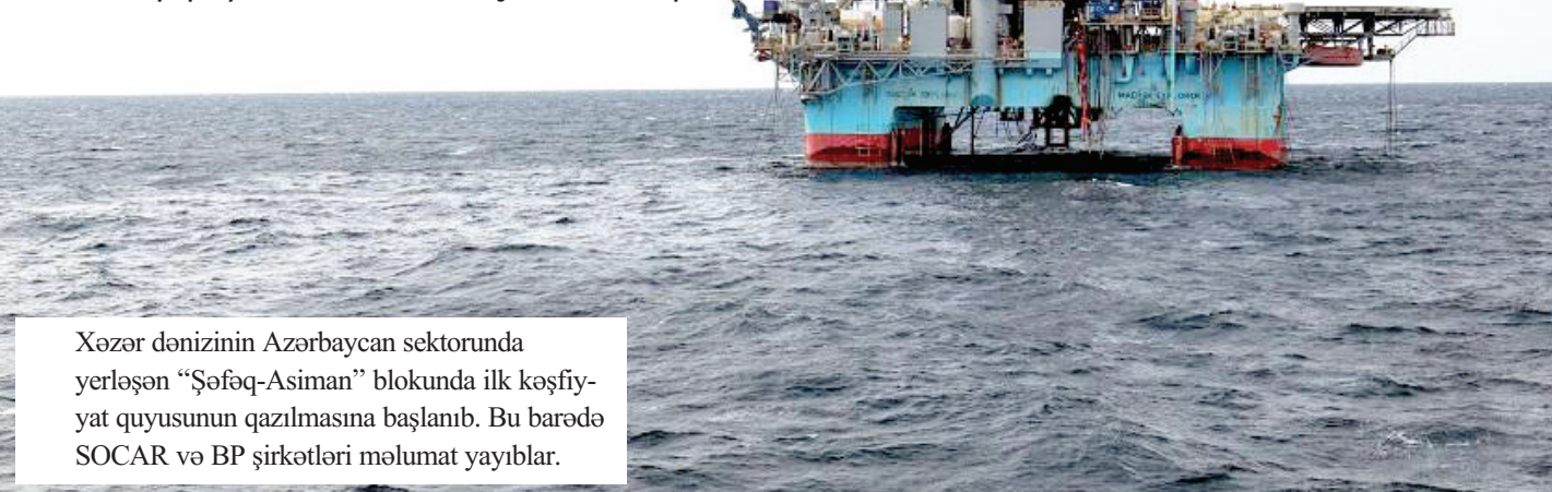
Xəzər dənizinin Azərbaycan sektorunda yerləşən «Şəfəq-Asiman» blokunda ilk kəşfiyyat quyusunun qazılmasına başlanıb. Bu barədə SOCAR və BP şirkətləri məlumat yayıblar.

Qazma əməliyyatları strukturun potensialının tam dəqiqləşməsinə imkan yaradacaq