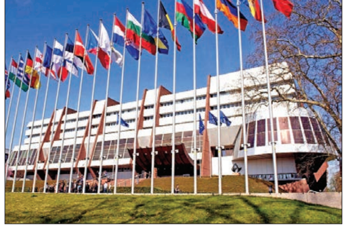
Şərq xalqlarının tarixi taleyini daha yaxşı və daha dərinləndirən dərk etməsinə kömək edəcəkdir. Bu, bir tərəfdən, qabaqcıl demokratik ideyaların, hüquqi baxışların yayılması, digər tərəfdən isə bütün xalqların milli-mənəvi xüsusiyyətlərinə hörmət bəslənilməsi üçün yaxşı zəmin olacaqdır. Mən bu mötəbər təşkilatın gələcək inkişafı və möhkəmlənməsində öz ölkəmizin xüsusi rolunu və məsuliyyətini bunda görürəm".

Ulu Öndər Heydər Əliyev 25 yanvar 2001-ci ildə AŞ PA sessiyasında çıxışı zamanı bu hadisəni belə qiymətləndirdi: "Tarixi yolların qovuşduğu yerləşən ölkəmizin Avropa Şurasına qəbul olunması həm Azərbaycan üçün, həm də bu təşkilat üçün çox mühüm hadisədir. Biz Ümumavropa dəyərləri xəzinəsinə öz töhfələrimizi gətirməyə hazırıq. Bu töhfələr həm Avropada demokratik sabitliyin möhkəmlənməsinə, həm də avropalılar