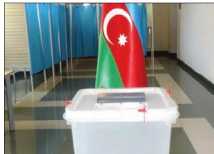
mat aldığı gündən başlayaraq 3 gün müddətində şikayət edə bilərlər.

Naxçıvan şəhər 4 sayılı Seçki Dairəsində keçirilən "Seçki hüquqlarının pozulmasına dair şikayətlərin məhkəmə qaydasında həlli" mövzusunda seminar-müşavirədə muxtar respublika üzrə dairə seçki komissiyalarının sədrləri və müavinləri, Şikayətlərin Araşdırılması Komissiyasının üzvləri iştirak ediblər.