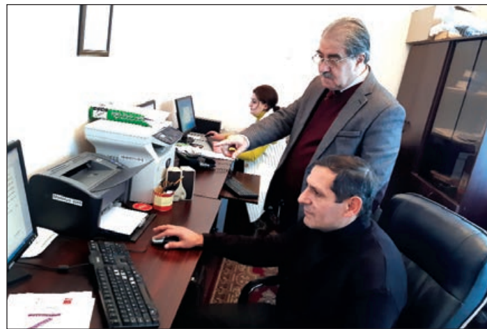
keçirmək istəyənlərinin dəqiq uçotu aparılır. Artıq qeydə alınmış müşahidəçilərin sayı 400-ə yaxındır. Onların sayı hər gün artmaqdadır.

47 sayılı Mingəçevir dairə seçki komissiyası üzrə deputatlığa namizədliyi qeydə alınmış 12 nəfər arasında seçki rəqabətli demokratik qaydalara uyğun qaydada davam edir. Hər bir namizəd üçün bərabər və normal şərait yaradılmışdır. Dairə seçki komissiyasının seçkilərdə müşahidə missiyasını həyata