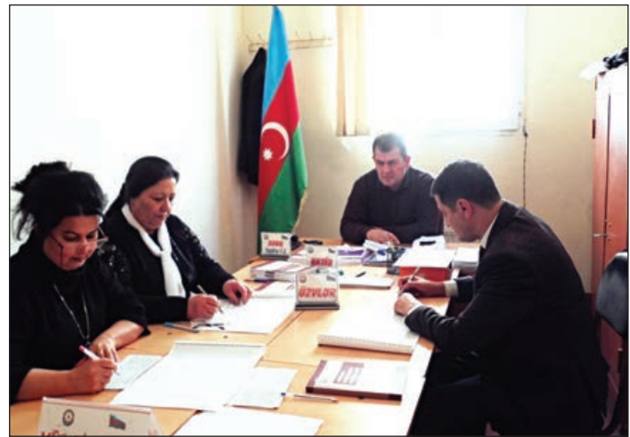
Ərazisi erməni qesbkarları tərəfindən işğal olunduqdan sonra qubadililər respublikanın 42 rayon və şəhərində müvafiq təşkilatları

şib. Onların əksəriyyəti Sumqayıt şəhərində yaşayır. Rayonun icra strukturları, idarə və təşkilatları da əsasən burada fəaliyyət göstərir.