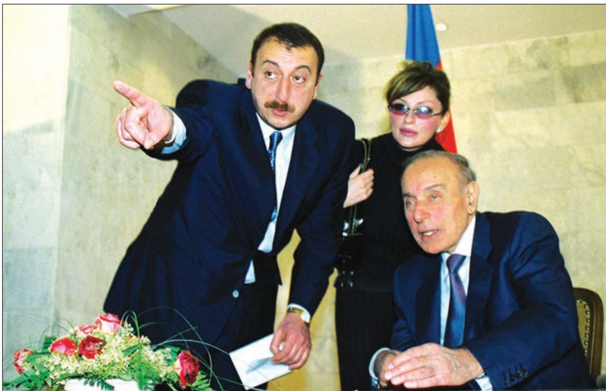
arası dialoq mühtiminin formalaşdırılmasının təşəbbüskarı olmuşdur.

Daim xalqımızın milli-mənəvi dəyərlərinin mütərəqqiliyini vurğulayan dövlət başçısı İlham Əliyev gələcək inkişafımızı zəngin tarixi keçmişə söykənən adət-ənənələrimizlə müasir ideyaların sintezində görməklə, ölkəmizdə milli-dini dəyərlərin qorunub saxlanılmasına istiqamətdə ardıcıl işlər həyata keçirir və götürən odur ki, bu tədbirlər davamlı olacaq.