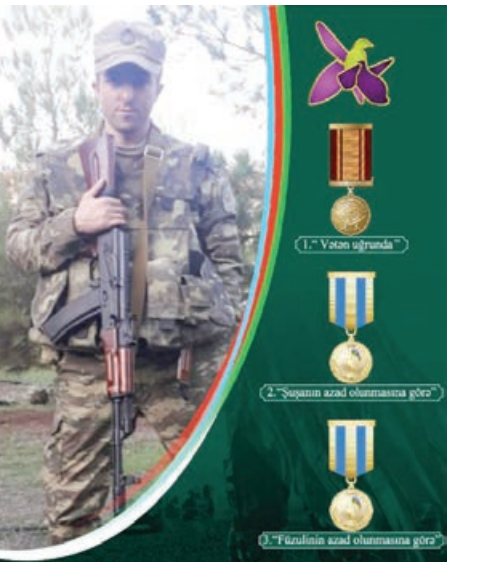
"ŞUŞA FƏTƏHİ" Əzizli Tacəddin