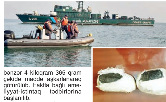
bənzər 4 kiloqram 365 qram çəkiddə maddə aşkarlanaraq götürülüb. Faktla bağlı əməliyyat-istintaq tədbirlərinə başlanılıb.

Noyabrın 21-də axşam saatlarında Dövlət Sərhəd Xidmətinin Sahil Mühafizəsinin Mərkəzi regional şöbəsi-