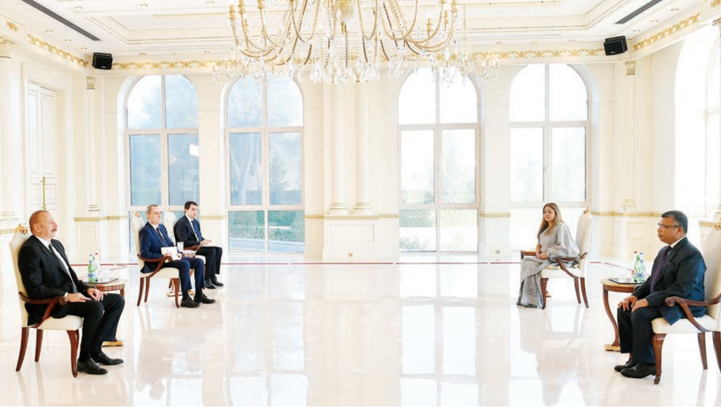
Əvvəli 1-ci səh.

Prezident İlham Əliyev ölkələrimiz arasında beynəlxalq təşkilatlar çərçivəsində yaxşı siyasi dialoqun aparıldığını vurğuladı və Azərbaycanın Qoşulmama Hərəkatına sədrlik müddətində 2023-cü ilədək uzadılmasında Banqladeşin göstərdiyi dəstəyə görə minnətdarlığını bildirdi. Dövlətimizin başçısı Azərbaycanın Qoşulmama Hərəkatına sədrliyi