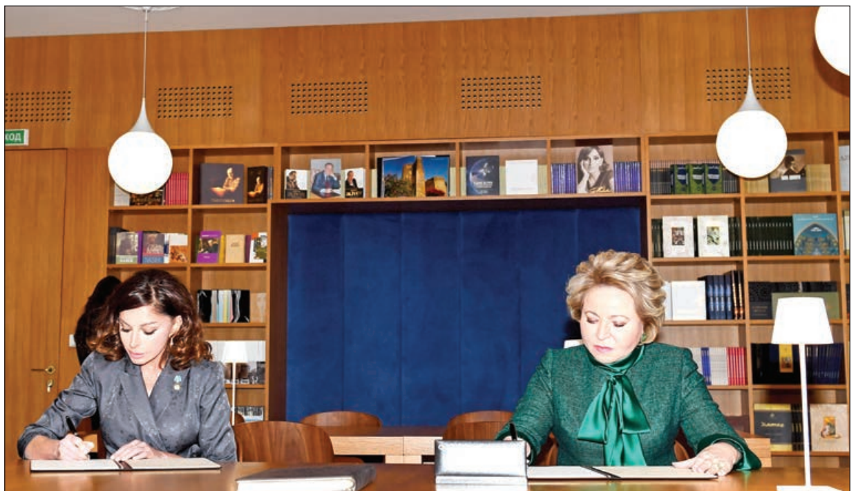
Əvvəli 1-ci səh.

Bu gündən isə Azərbaycanın da Xalq Təsərrüfatı Nailiyyətləri Sərgisində öz evi var. Heydər Əliyev Fondunun dəstəyi ilə buradakı "Azərbaycan" pavilyonu əsaslı bərpa olub.