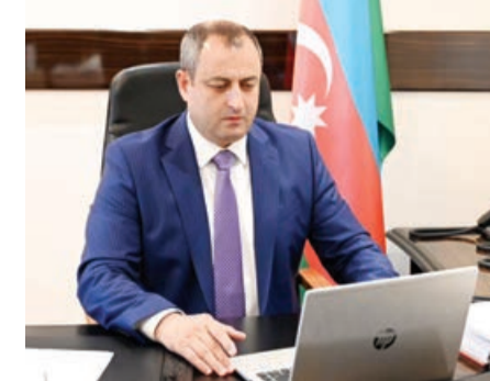
Sonra "Milli təhlükəsizlik haqqında" model qanun layihəsi, "Sərhəd təh-

uğurlar arzulayıb. Təhlükəsizlik, sərhədlərin toxunulmazlığı məsələsinin vacibliyinə toxunan sədr müavini, dövlətlərin sülh içində birgə yaşamaqlı olduğunu, bir-birinin sərhədlərinə hörmətlə yanaşmasının zərurətini diqqətə çatdırıb. Ölkələrarası münasibətlərin beynəlxalq hüququn norma və prinsiplərinə uyğun tənzimlənməli olduğunu qeyd edən vitse-spiker daha sonra hazırlanan qanun layihələri və gündəlik barədə geniş məlumat verib.