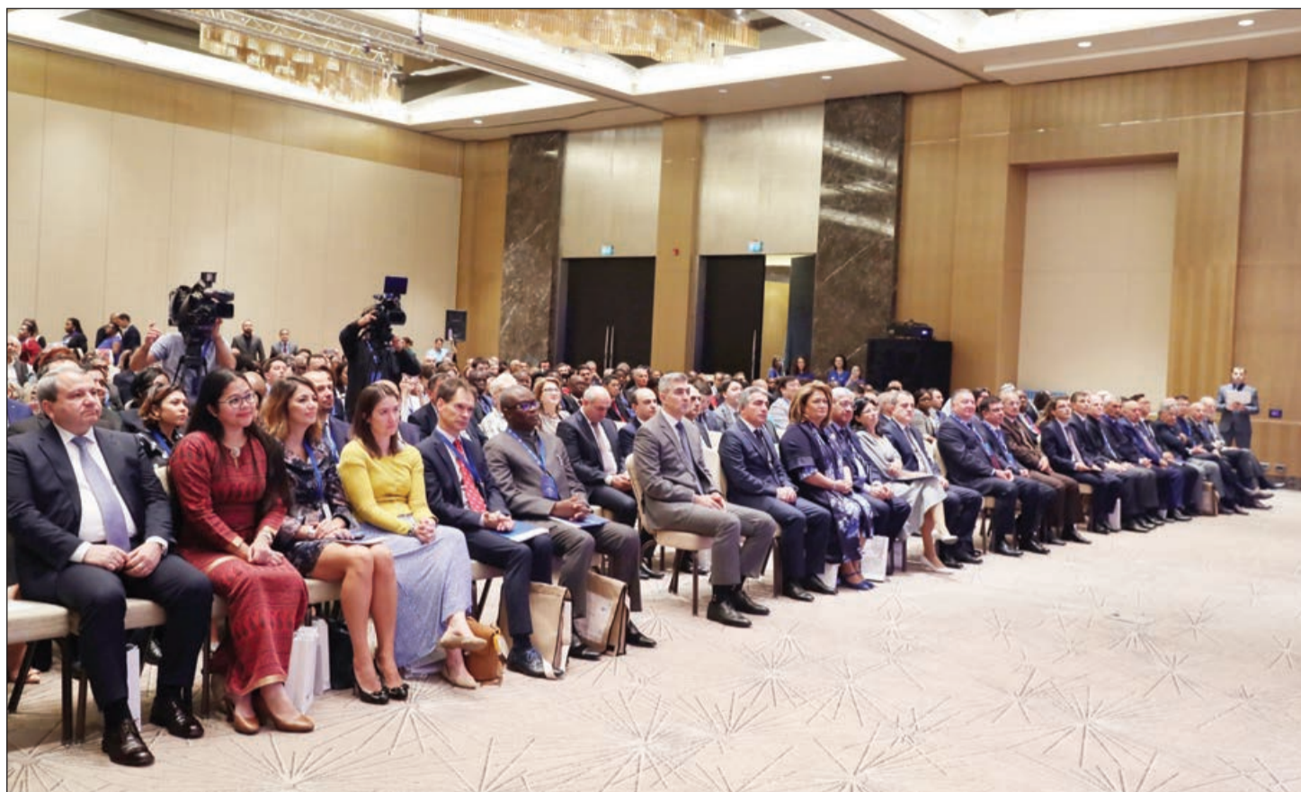
Əvvəlki 2-ci səh.

Bundan əlavə, biz, Astana Dövlət Qulluğu üzrə Regional Xab tərəfindən dəstəklənən dövlət qulluğu panelini də bu ilki proqrama daxil etmişik. Ümid edirik ki, panel sessiyaları və müzakirələr intellektual baxımdan stimullaşdırıcı və faydalı olacaq.