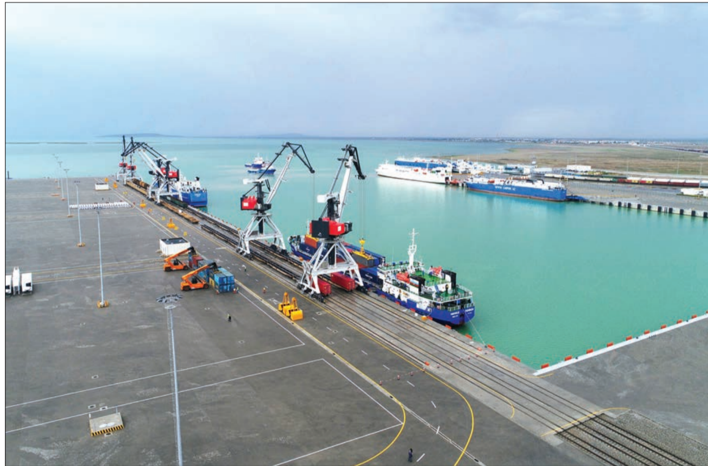
Əvvəlki 1-ci sahə.

Prezident İlham Əliyevin global miqyaslı təşəbbüsləri ilə Azərbaycan regionun mərkəzi qovşağına çevrilib