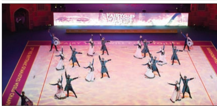
ti cari il ölkəmizdə gimnastika üzrə keçirilən sonuncu beynəlxalq turnir idi. Növbəti irimiqyaslı yarışlarda görüşəndək.

Beynəlxalq Gimnastika Federasiyasının (FIG) prezidenti Moriari Vatanabe deyib: "Nağıllar - hətta ən yaxşıları belə bitməlidir. Bir həftəlik yarışlardan sonra nağıl kitabımızı bağlamağın vaxtıdır. Bütün gimnastları gözəl çıxışlarına görə təbrik edirəm. Nağıl bezi gimnastlar üçün "Tokio 2020" Yay Olimpiya Oyunlarında davam edəcək".