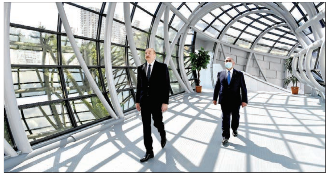
Əvvəlki 1-ci səh.

Elə sözügedən keçidin açılışı zamanı Prezident İlham Əliyev məlumat verdi ki, Bakı-Quba-Rusiya Federasiyası ilə dövlət sərhədi avtomobil yolunun 7-ci kilometrliyində, Bakı Beynəlxalq Avtovağzal Kompleksi ilə metronun “Avtovağzal” stansiyası arasındakı ərazidə əsas yolun hərəkət hissəsi genişləndirilərək zolaqların sayı 4-ə çatdırılmışdır. Bundan əlavə, paytaxtın şimal girişində günün gur saatlarında yaşanan tıxacların aradan qaldırılması üçün icra edilən layihə çərçivəsində “20 Yanvar” dairəsində yolun hərəkət hissəsi 10 metr qədər, magistral yolun Bakı Beynəlxalq Avtovağzal Kompleksinin qarşısından keçən hissəsi isə hər iki istiqamət üzrə bir hərəkət zolağı enində genişləndirilmişdir.