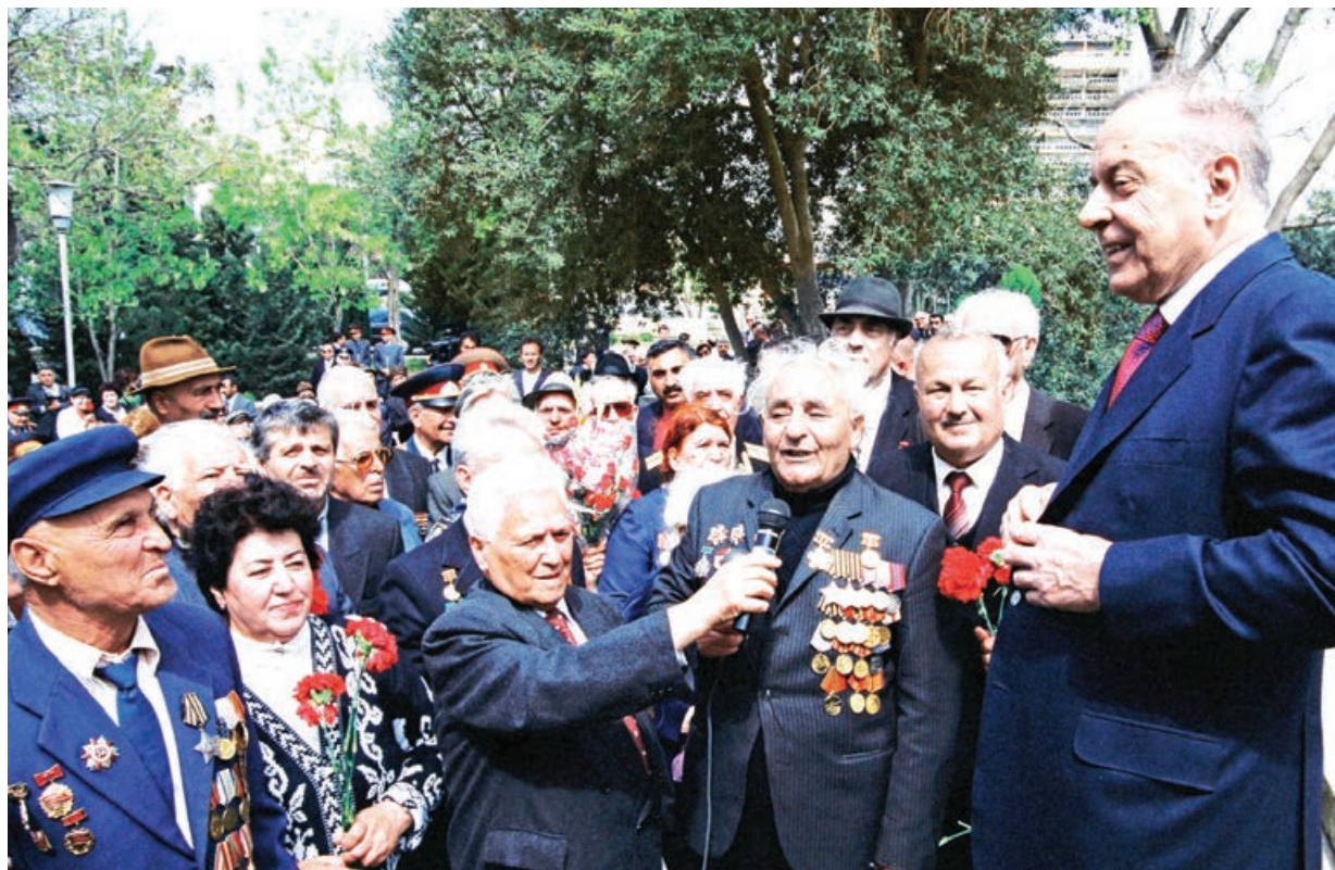
Prezident İlham Əliyev veteranlara medalları təqdim edir.

Böyük tarixi şəxsiyyətləri karakterizə edən əsas xüsusiyyətlərdən ən başlıcası onların vətəninə və xalqına sıx bağlılığı, siyasi kamilliklə vətəne, xalqa bağlılıqdan yoxsulmuş mənəvi yetkinliyi öz fəaliyyətlərində eyni dərəcədə bütün şəkildə təəcəssüm etdirmələridir. Dünyaşöhrətli müdrik siyasi şəxsiyyət, görkəmli dövlət xadimi, bütün türk dünyasının iftixarı olan və 100 illik yubileyini dərin ehtiram hissi ilə qeyd etdiyimiz Ümummilli Lider Heydər Əliyevin Azərbaycanın inkişafı, böyük perspektivlərə doğru inamla addımlaması naminə misilsiz tarixi xidmətlərinin əsasında da ilk növbədə onun vətəninə və xalqına sıx bağlılığı, zamanımızın ən böyük azərbaycanlısı olması dayanır. Onun müəllifi olduğu uğurlu sosial inkişaf strategiyası da məhz əhalinin rifahına olan böyük qayğıya əsaslanır.