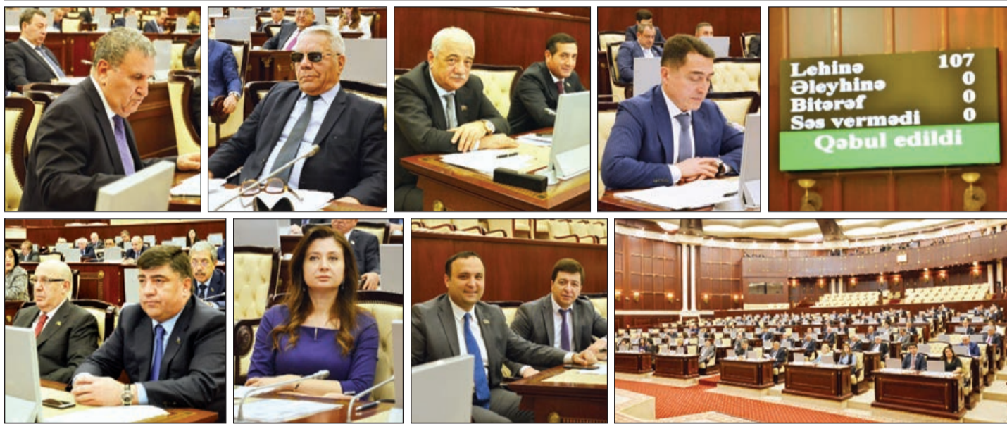
Yayım Şurasının üzvlərinin seçilməsi haqqında Azərbaycan Respublikası Milli Məclisinin Qərarı