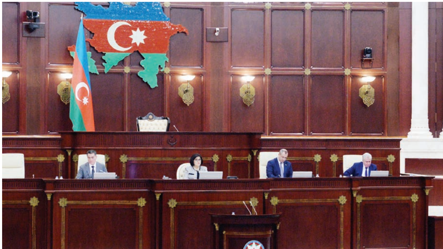
Əvvəlki 1-ci sahə.

Deputatlar Prezident İlham Əliyevin yenidən dövlət başçısı seçildikdən sonra ilk rəsmi səfərini, həmişə olduğu kimi, Türkiyəyə etməsi Azərbaycan-Türkiyə dostluğunun yüksək səviyyədə olduğunu göstəricisi kimi dəyərləndiriblər. Millət vəkili ötən 20 ildə aparılan siyasət nəticəsində ölkəmizin geosiyasi mövqeyinin daha da güclənməsindən, regionda həyata keçirilən layihələrin əhəmiyyətindən danışdı. Bildirilib ki, Azərbaycanın reallaşdırdığı neft-qaz layihələri regionun və Avropanın enerji təhlükəsizliyinə töhfə verir.