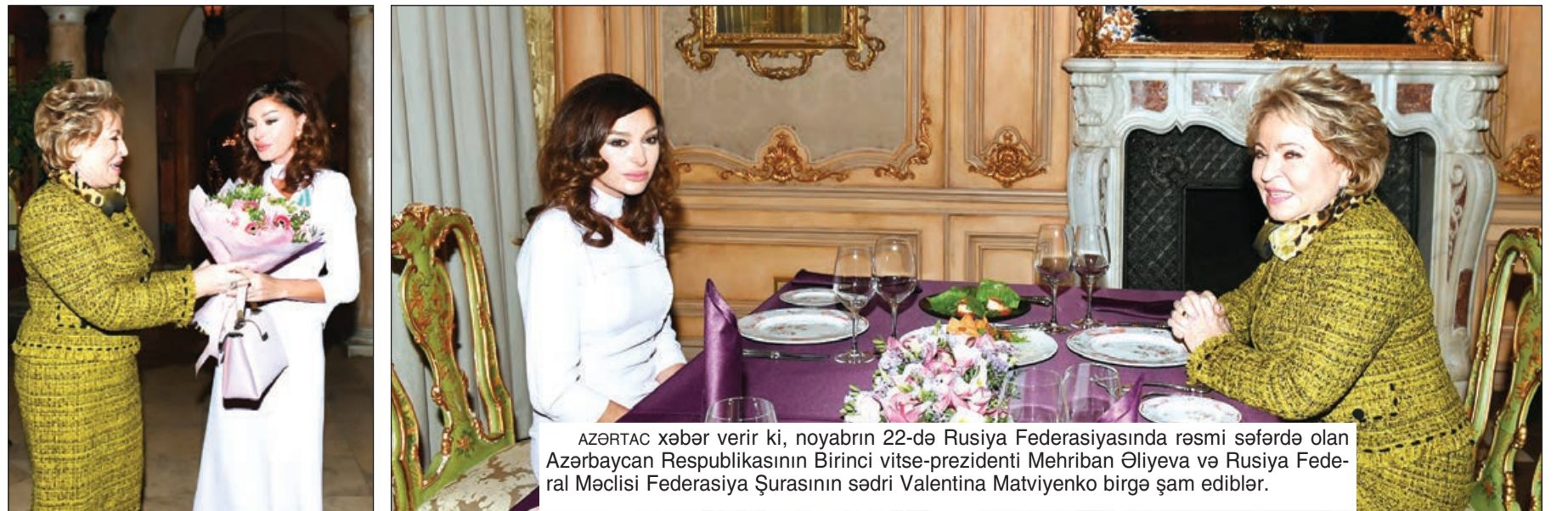
AZƏRTAC xəbər verir ki, noyabrın 22-də Rusiya Federasiyasında rəsmi səfərdə olan Azərbaycanın Birinci vitse-prezidenti Mehriban Əliyeva və Rusiya Federal Məclisi Federasiya Şurasının sədri Valentina Matviyenko birgə şam ediblər.