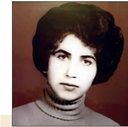
Füzuliyə son səfərim 1993-cü ildə, işğala bir ay qalmış, iyul ayında olmuşdu. Şəhərin bu başından o başına piyada evimizə getdik. Evin qapısını açmadıq, yalnız sınıq pəncərələrdən baxdıq içərisinə. Çünki evimizi dağılmış halda görmək istəmədik...