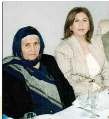
Anam Tanrıya üz tutub diləyirdi ki, "mənə möhlət ver, gedim o yurdu görmür, dünyamı dəyişim". Anamın bu diləyi yerinə yetmədi...

Kiminsə gücü yetirdi, bu hissələri hər zaman pərdələməyə çalışırdı, kimisi də bunu bacarmırdı. Məsələn, mən hər zaman çalışmışdım ki, onlar mənim təmsalimə bütün, güclü bir insan görünsün. Çünki əli hər yerdən üzülən və taleyinin bu qisməti ilə barışmaq, onu qəbul etmək istəməyən insanların qarşısına gə-