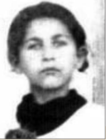
Füzulidən 15 yaşında çıxmışam. Amma sanki ömrümün ən mənalı, dəyərli hissəsi elə həmin o 15 ildən ibarətdir.