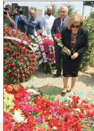
Bu yurd üçün canını verən, qanını o torpağa tökən, ömrünün cavan yaşında qurban gedən cavanlarımız qarşısındakı vəzifələrimiz çox mühümdür.

Elə həyatda da hər zaman onları bu cür xatırlayırdım. Füzuli ilə bağlı hər zaman xatırladığım ilk mənzərə həyatimizin qapısından girəndə atamla anamın hər ikisinin qollarını açaraq mənə qarşı-laması olur. İndi mənə elə gəlir ki, Füzuliyə qədəm qoyanda yəni əvvəlki kimi olacaq. Həyatımız girəndə mənə atamla anam qarşılayacaq... Əlbəttə, qarşılayacaq, amma bu dəfə ruhları.