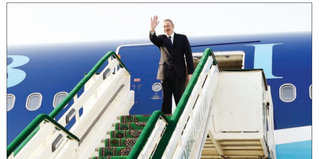
Azərbaycan Respublikasının Prezidenti İlham Əliyevin Türkmənistana rəsmi səfəri noyabrın 22-də başa çatıb.