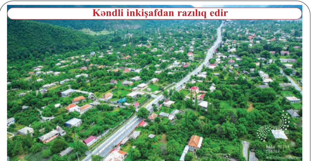
Kəndli inkişafdan razılıq edir