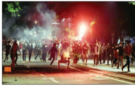
nin rəsmi nümayəndəsi Dedi Prasetyo bildirmişdir ki, mitinglərdə qayda-qanunu təmin edən polis əməkdaşlarına odlu silah verilməmişdir.

Cakarta qubernatoru Anis Basvedanın verdiyi məlumata görə, toqquşma nəticəsində azı 6 nəfər həlak olmuş, təxminən 200 nəfər yaralanmışdır. Öz növbəsində hüquq mühafizə orqanları-