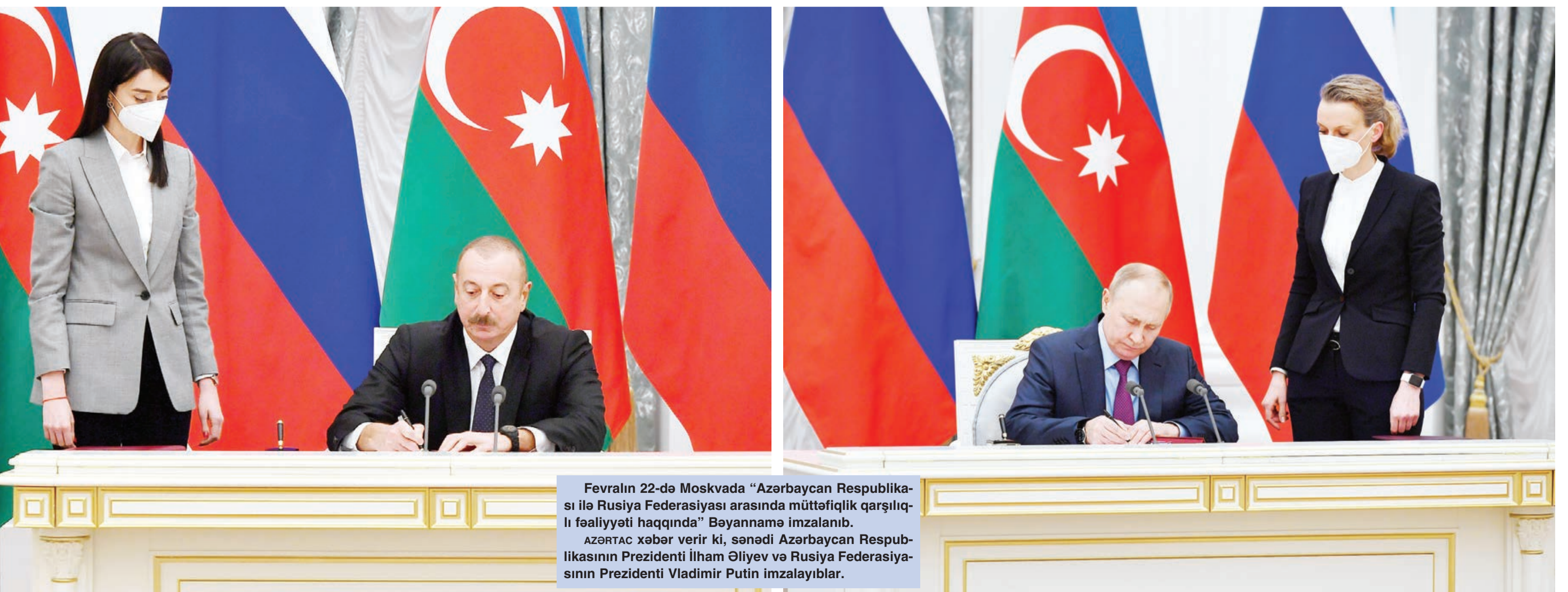
Fevralın 22-də Moskvada "Azərbaycan Respublikası ilə Rusiya Federasiyası arasında müttəfiqlik qarşılıqlı fəaliyyəti haqqında" Bəyannamə imzalanıb. AZƏRTAC xəbər verir ki, sənədi Azərbaycan Respublikasının Prezidenti İlham Əliyev və Rusiya Federasiyasının Prezidenti Vladimir Putin imzalayıblar.