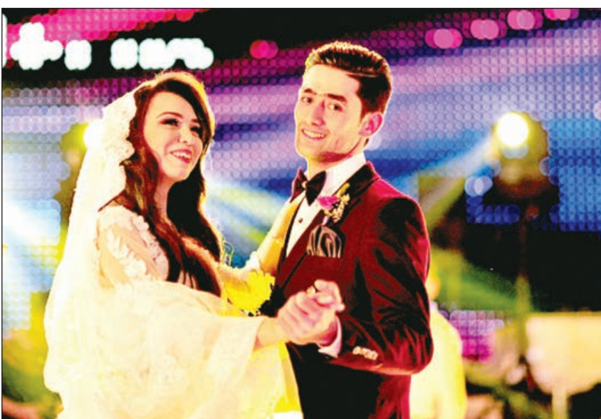
Əvvəlki 1-ci səh.

Taleyi uşaq evində yazılan cütlüyün nisgil və sevinc dolu həyat hekayəsi