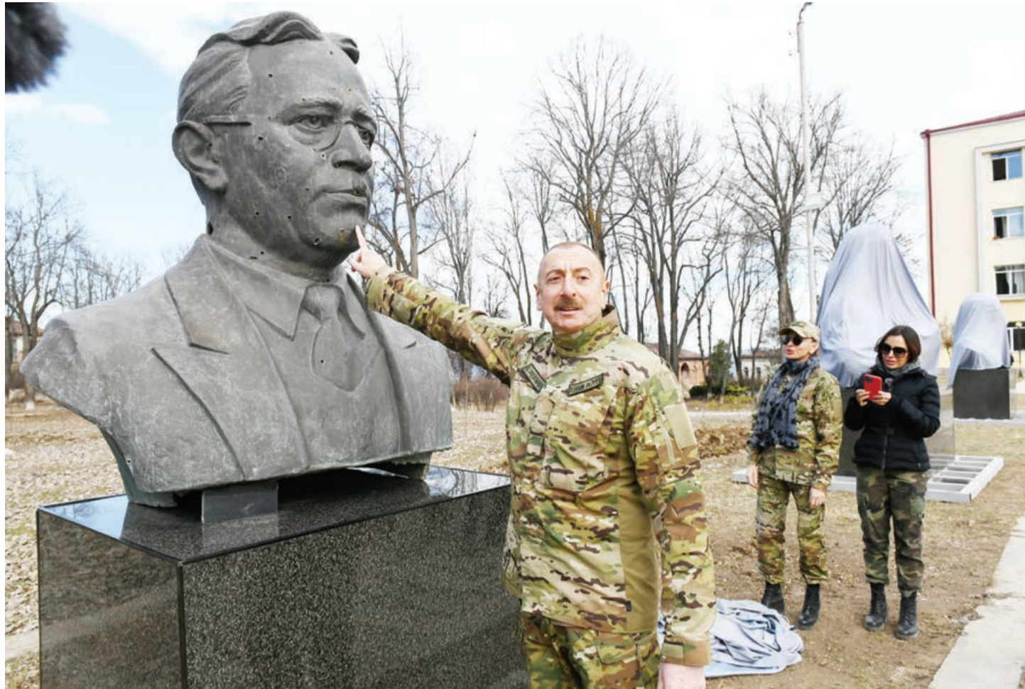
"Demışdim ki, Şuşanı biz dirçəldəcəyik"

"Xarıbülbül" festivalında Azərbaycan xalqı bir daha bütün dünyaya öz birliyni nümayiş etdirirdi.