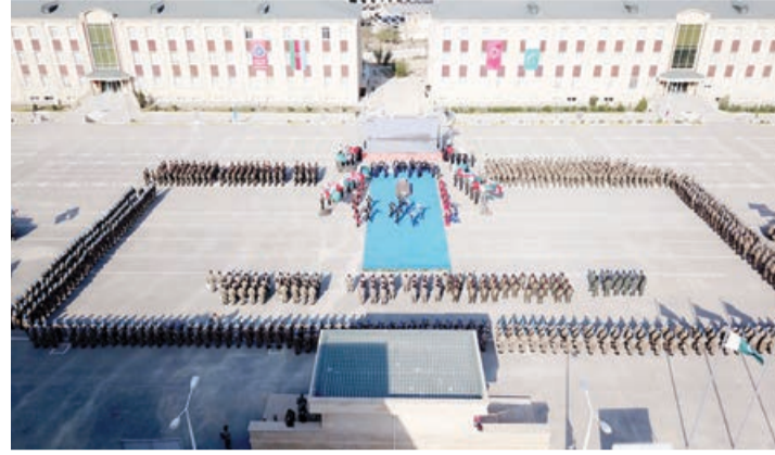
Əvvəli 1-ci sah.

İştirakçı ölkələrin dövlət himnləri ifa olunduqdan sonra general-leytenant Hikmət Mirzəyev qonaqlara və şəxsi heyətə müraciət edərək bildirdi: "Təlimdə iştirakçılar yüksək bacarıq nümayiş etdirərək tapşırıqları uğurla yerinə yetirdilər. Əminəm ki, təlimlər zamanı bacarıqlarınız artırıldı və hamınız üçün çox faydalı olan fikir və təcrübə mübadiləsi imkanı əldə etdiniz. Birgə təlimlər xalqlarınız arasındakı dostluğu, ölkələrimiz arasında sıx əməkdaşlığın bir nümunəsidir. Təlim döyüş sahəsində üç qardaş ölkənin hərbiçilərinin bir yerdə olması, çiyin-çiyinə tapşırıq yerinə yetirməsi hər birimizi qürurlandırdı".