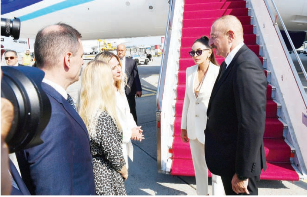
Avqustun 20-də Azərbaycan Respublikasının Prezidenti İlham Əliyev Macarıstanın Baş naziri Viktor Orbanın dəvəti ilə Budapeştə işgüzar səfər edib.