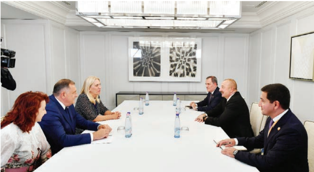
Avqustun 20-də Budapeştə Azərbaycan Respublikasının Prezidenti İlham Əliyevin Bosniya və Herseqovinanın Rəyasət Heyətinin üzvü xanım Jelka Tsviyanoviç və Serb Respublikasının Prezidenti Milorad Dodik ilə görüşü olub.

Azərbaycan Prezidenti İlham Əliyevin Bosniya və Herseqovinanın Rəyasət Heyətinin üzvü xanım Jelka Tsviyanoviç və Serb Respublikasının Prezidenti Milorad Dodik ilə görüşü olub