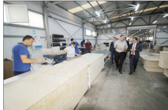
Əvvəli 1-ci sah.

2000-ci ildən fəaliyyət göstərən "Salolğu" mebel fabriki bu gün neinki Azərbaycan, hətta ölkə hüdudlarından kənar da tanınır. Fabrik qərb bölgəsinin ən böyük müəssisələrindən biri kimi, məhsulları ilə xarici bazarlarda "Made in Azerbaijan" brendini layəqətlə təmsil edir.