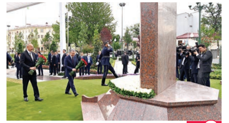
Daşkənddə Heydər Əliyev Meydanının açılış mərasimi