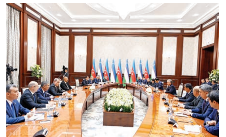
Geniş tərkibdə görüş