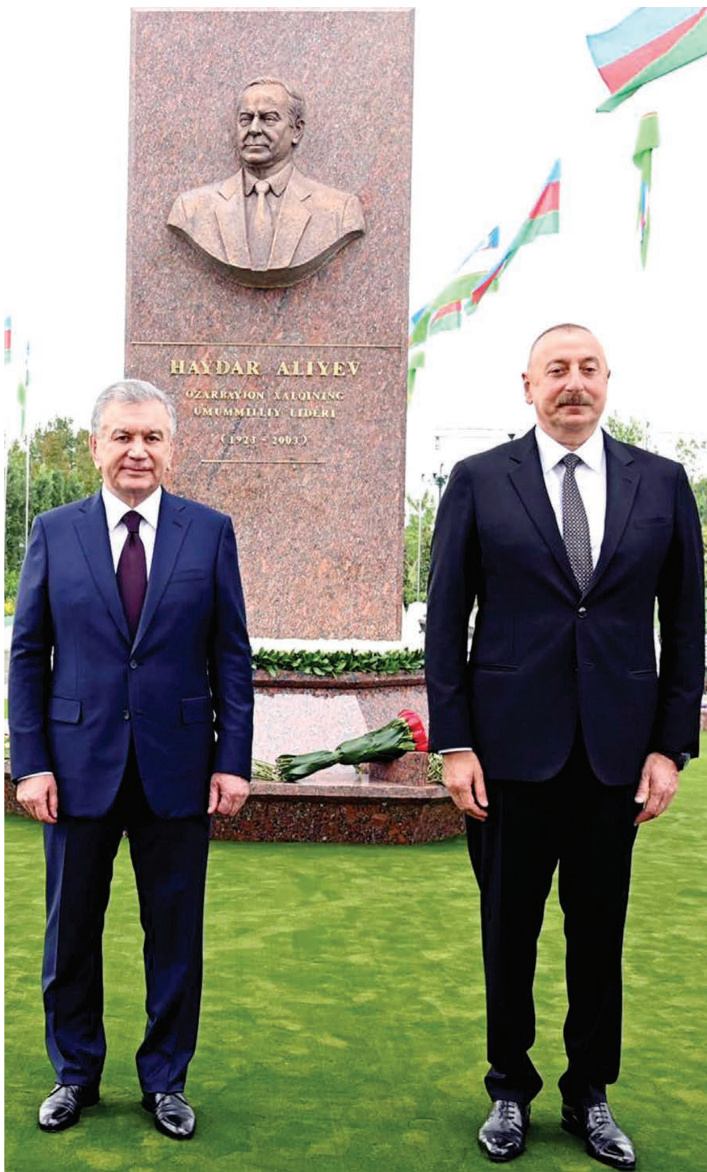
Azərbaycan Prezidenti İlham Əliyevin Özbəkistana dövlət səfəri