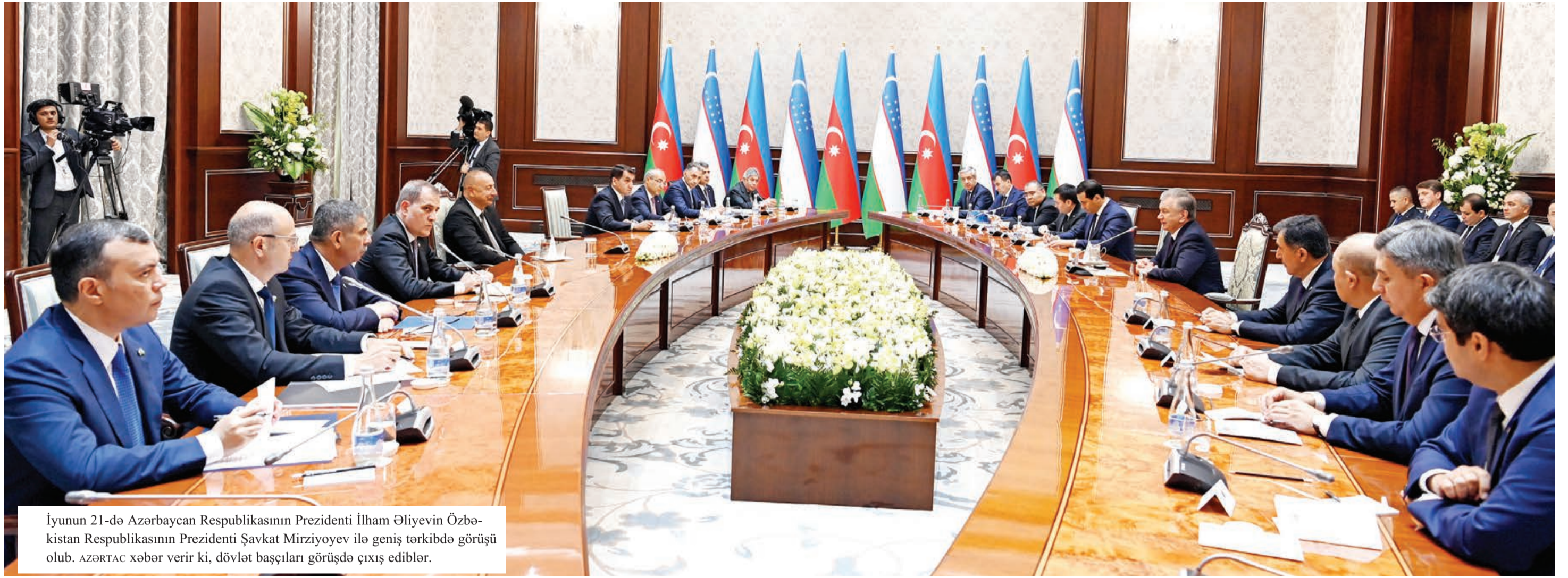
İyunun 21-də Azərbaycan Respublikasının Prezidenti İlham Əliyevin Özbəkistan Respublikasının Prezidenti Şavkat Mirziyoyev ilə geniş tərkibdə görüşü olub. AZƏRTAC xəbər verir ki, dövlət başçıları görüşdə çıxış ediblər.