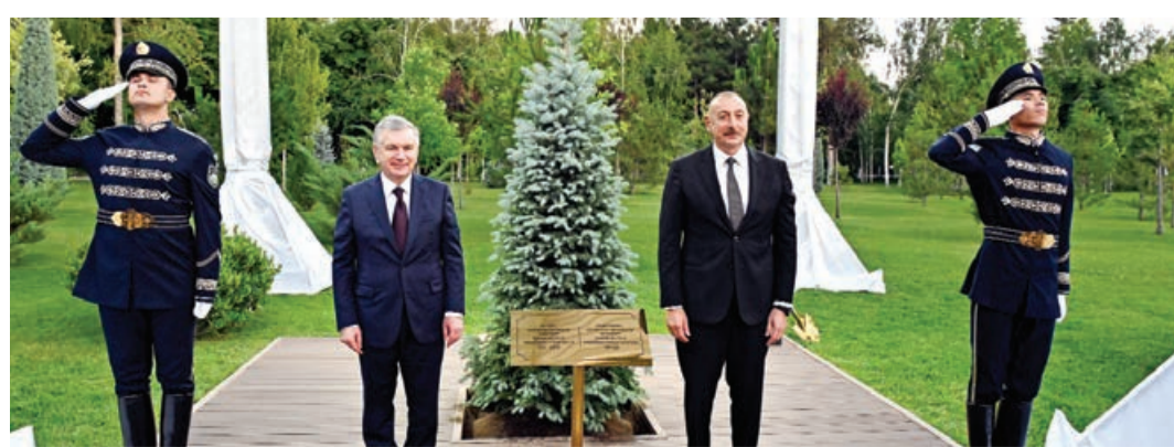
Fəxri qonaqlar xiyabanında ağacəkmə