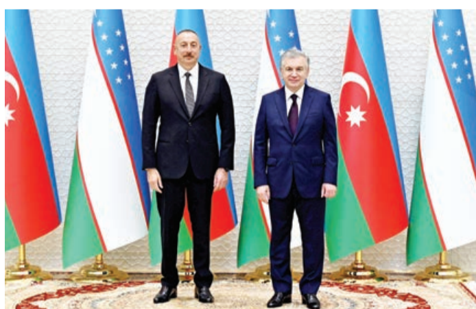
Məhdud tərkibdə görüş