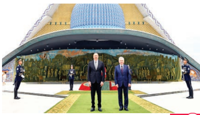
Daşkənddə Müstəqillik abidəsini ziyarət