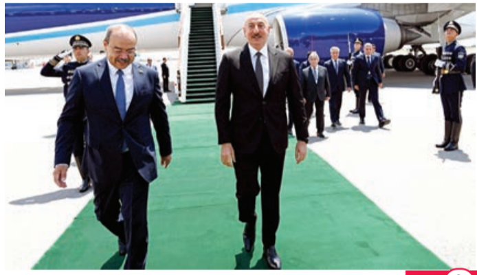
Daşkənd Beynəlxalq Hava Limanında qarşılanma