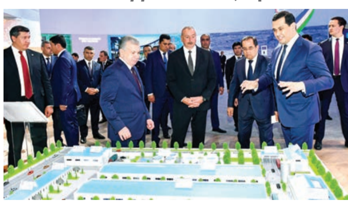
"TEXNOPARK" MMC-nin fəaliyyəti ilə tanışlıq