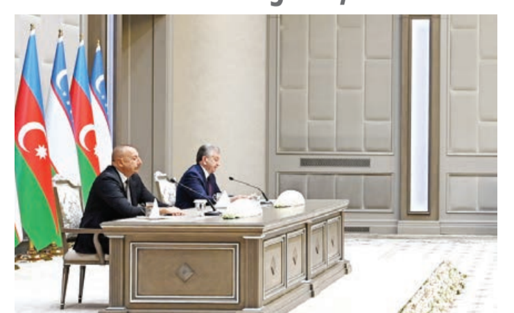
Mətbuata birgə bəyanat