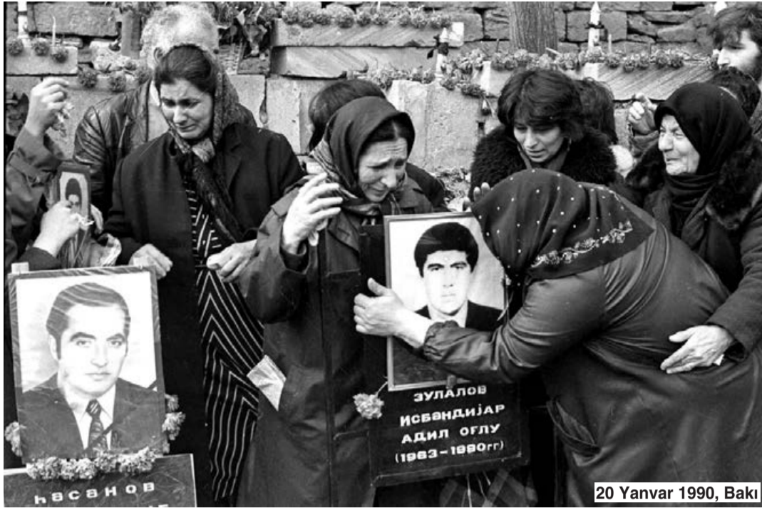
20 Yanvar 1990, Bakı

Bəzən ömür bizi çox uzun gəlir, çünki saniyələr, saatlar, günlər, aylar və illər var. Amma reallıqlar başqadır: Yer Günəşin başına 50-60 dəfə, ya da ondan bir az çox dolanan kimi ömür bitir... Sən demə, həyatımız aylardan və illərdən yox, yaddaşımıza həkk olunan xatirələrdən ibarətmiş. 1990-cı il yanvarın 19-dan 20-nə keçən gecə hamı eyni dərcədə kükrəyən dölisov bir ruhla təslim olmuş və hər birimizin ürəyi Bakının qaralıq çökən küçələrində məşəl kimi alışıb yanmış.