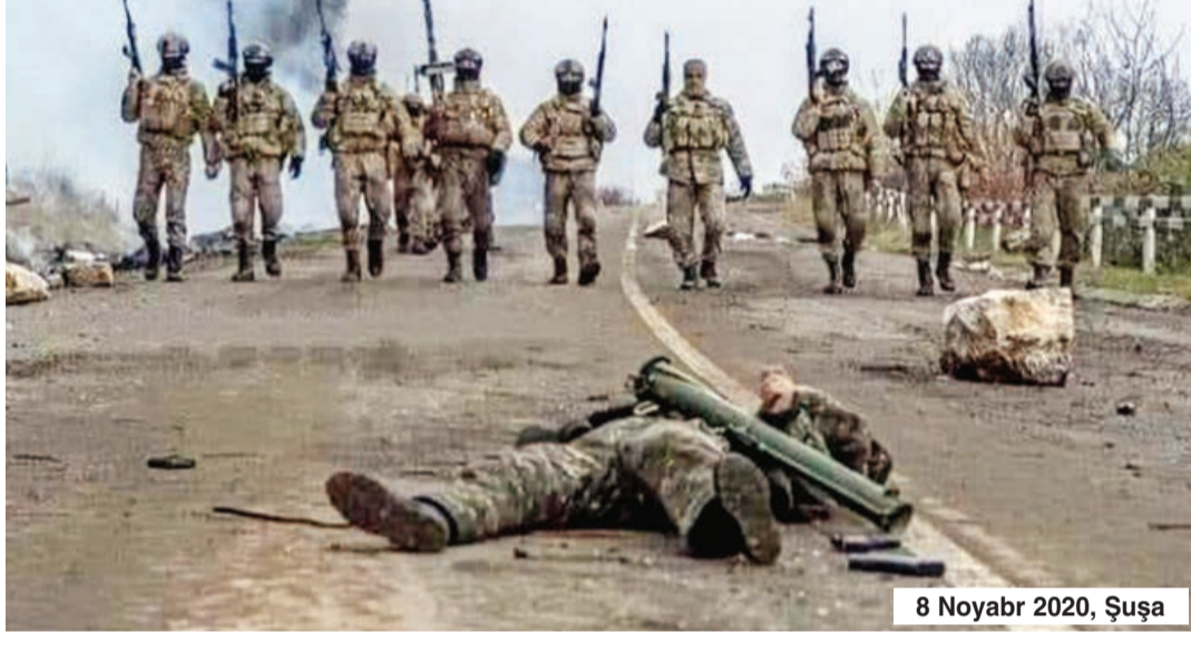
8 Noyabr 2020, Şuşa

Unutmadığım və yaddaşım da sərbəstləşməyə başlayan xatirələrdən biri şəhidlərin dəfni günü on minlərlə insanın hönkür-hönkür ağlaması idi. Mən də hönkürən izdihamın içində bir damla göz yaşından savayı bir şey deyildim. Şəhidlər xiyabanından yollara döşənən qorənfilər də gözlemədikləri aqibətin sahibləri kimi ağlarını küçələrin not dəftərinə qan daman ləçəkləriylə düzür-