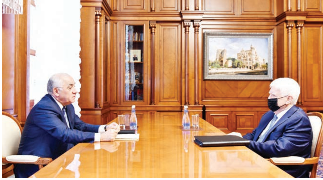
Azərbaycan Respublikasının Baş naziri Əli Əsədov dekabrın 20-də Rusiya Federasiyasının ölkəmizdəki səfiri Mixail Boçarnikov ilə görüşüb.