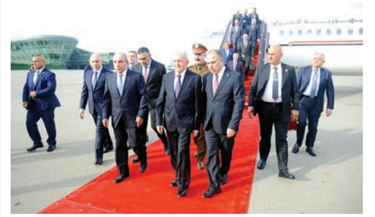
İraq Respublikasının Prezidenti Əbdüllətif Camal Rəşid noyabrın 19-da Azərbaycan Respublikasına rəsmi səfərə gəlib.

AZƏRTAC xəbər verir ki, hər iki ölkənin Dövlət bayraqlarının dalğalandığı Heydər Əliyev Beynəlxalq Aeroportunda ali qonağın şərəfinə fəxri qarovul dəstəsi düzülmüşdü.