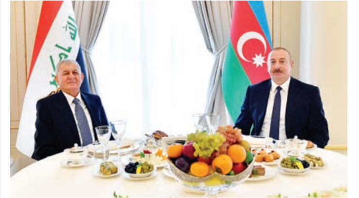
Noyabrın 20-də Azərbaycan Respublikasının Prezidenti İlham Əliyevin adından İraq Respublikasının Prezidenti Əbdüllətif Camal Rəşidin şərəfinə rəsmi nahar verilib.

Azərbaycan Prezidentinin adından İraq Prezidentinin şərəfinə rəsmi nahar verilib