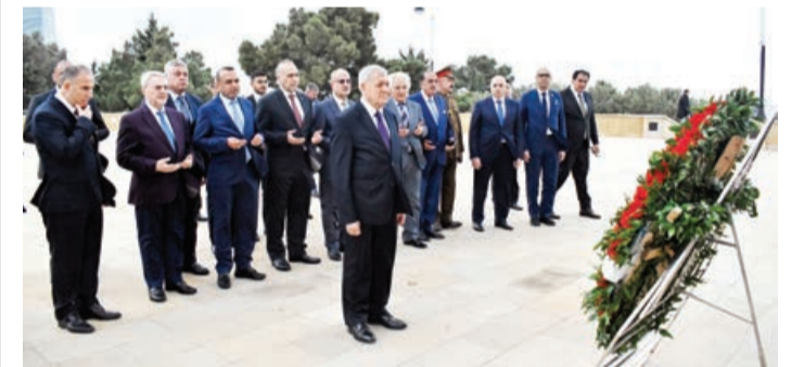
İraq Respublikasının Prezidenti Əbdüllətif Camal Rəşid noyabrın 19-da Fəxri xiyabana gələrək, xalqımızın Ümmümilli Lideri, müasir müstəqil Azərbaycan dövlətinin memarı və qurucusu Heydər Əliyevin xatirəsinə ehtiramla yad edib, məzarı önünə əkil qoyub, gül dəstələri düzüb.

AZƏRTAC xəbər verir ki, Ulu Öndərin ömür-gün yoldaşı, gərgin oftalmoloq-alm, akademik Zərifə Əliyevanın da xatirəsinə yad edilib, məzarı üzərinə tər çiçəklər düzülüb.