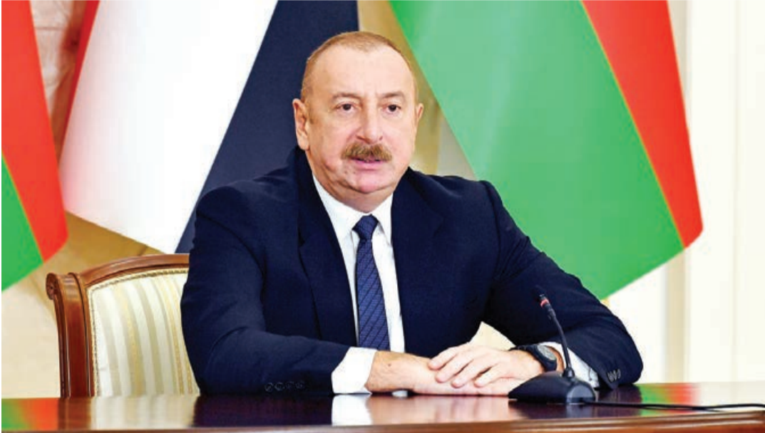
Noyabrın 20-də Azərbaycan Respublikasının Prezidenti İlham Əliyev və İraq Respublikasının Prezidenti Əbdüllətif Camal Rəşid mətbuata bəyanatlarla çıxış ediblər. AZƏRTAC xəbər verir ki, əvvəlcə Azərbaycan Prezidenti bəyanatla çıxış etdi.