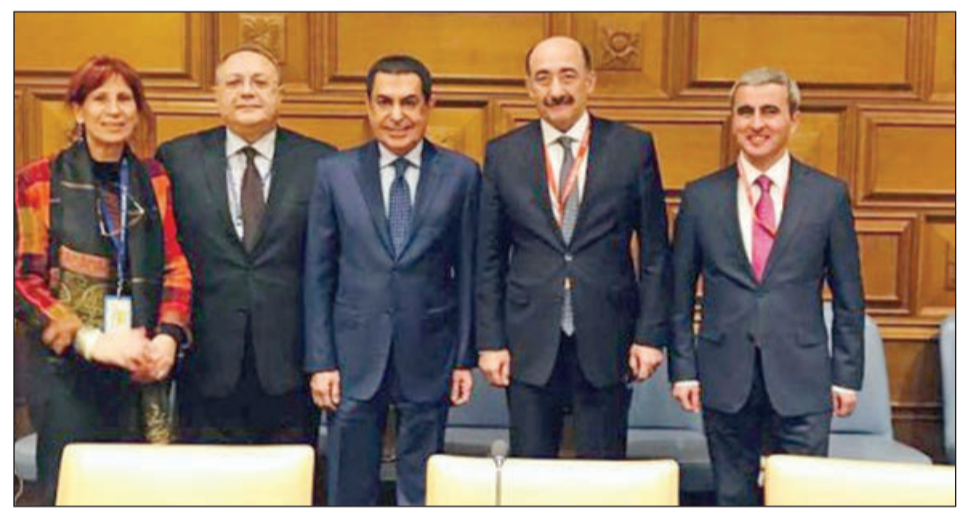
hazırlıq işlərinin başladığını və forumun işində BMT-nin Sivilizasiyalar Alyansı ilə əməkdaşlığın davam etdiriləcəyini diqqətə çatdırıb.

Nazir Əbülfəs Qarayev 2019-cu ildə ölkəmizdə keçiriləcək 5-ci Ümumdünya Mədəniyyətlərərsi Dialeq Forumuna