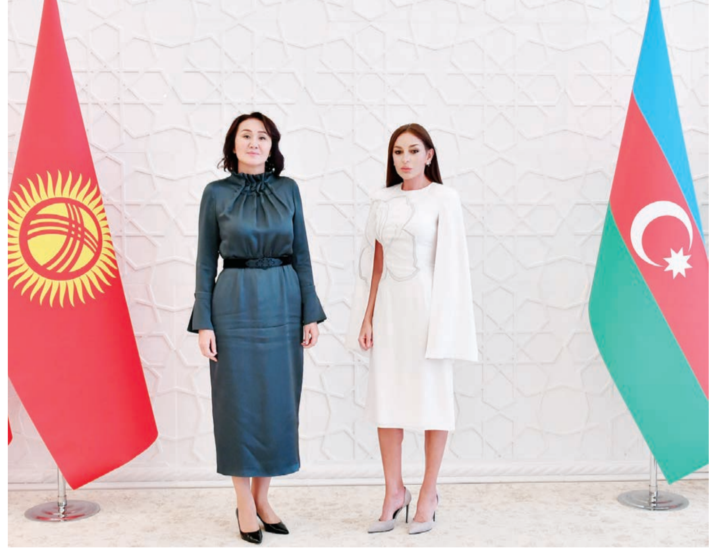
Aprəl 20-də Azərbaycan Respublikasının birinci xanımı Mehriban Əliyevanın Qırğız Respublikasının birinci xanımı Ayqul Japarova ilə görüşü olub.