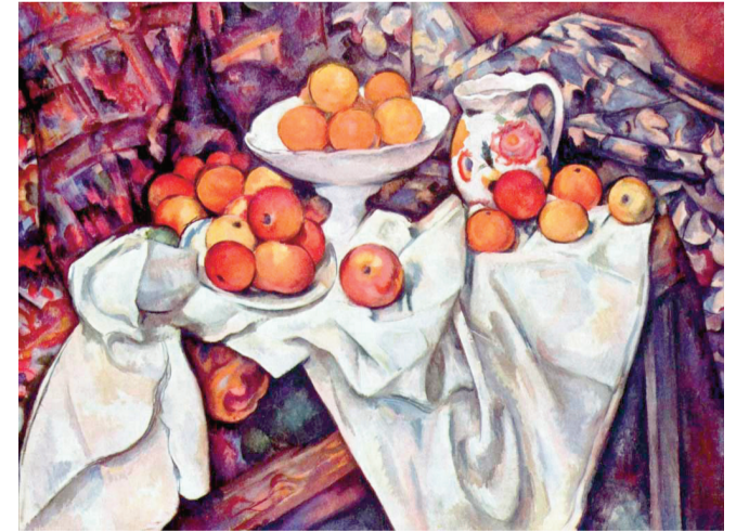
Məşhur fransız rəssamı, postimpressionizm cərəyanının yaradıcısının natürmortu

Qəzetimizin ötən nömrəsində getmiş krossvordun cavabları: