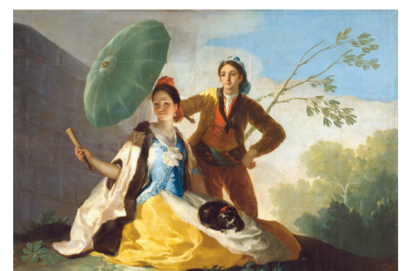
İspan rəssamın ən məşhur rəsmlərindən biri: «Çetir». 1777-ci il. Prado muzeyi, İspaniya, Madrid

nodar diyarında şəhər; 5.Kamboca yaxınlığında, Siam körfəzində ada; 7.Fizikanın bölməsi; 8.Avropanın qitəsinə göl; 10.Rəngarəng, ala-bəzək; 11.İtaliyanın 1948-ci il Konstitusiyası ilə qismən regional muxtariyyət verilmiş 20 regionundan biri; 12.Azərbaycanın bariton səsləli opera müğənnisi, əməkdar artist. Rusiyanın Dövlət Akademik Böyük Teatrın ilk azərbaycanlı solistinin adı; 14.Ağ buğda unundan bişirilən kökə; 19.Uzunqanadkimilər dəstəsinə aid yeganə quş fəsiləsi. Bu fəsiləyə mənsub quşlar arxaya uça bilər; 21.Ahçıya göndərilən və ya buraxılan malların adı, növü, miqdarı, qiyməti yazılmış siyahı göstərən sənəd; 22.Tibet, Monqolustan və Buryatıyada budda rahibi; 23.Avtomobil markası; 24.Min