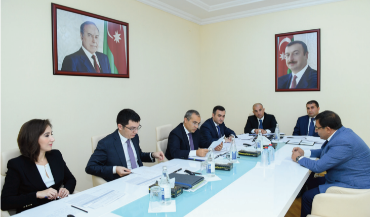
Vətəndaşların müraciətləri dinlənilib, əksər məsələlər yerində həllini tapıb, bir sıra müraciətlərlə bağlı nazirliyin struktur bölmələrinə tapşırıqlar verilib.

Qəbul zamanı vətəndaşlar, əsasən, yaranmış vergi borcları, vergi orqanlarında işlə təminat, kənd təsərrüfatı məhsullarının ixracı və vergi inzibatchılığı sahəsində qarşılaşdıqları məsələlərlə əlaqədar müraciət ediblər.