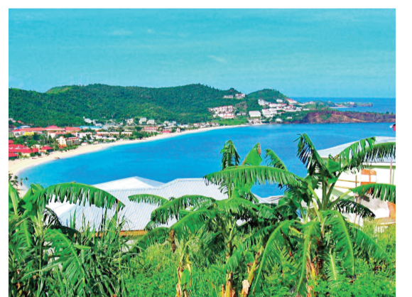
Qərrib dənizinin cənub-şərqində ada

Yuxarıdan aşağı: 1.Saz havası; 2.Respublikamızda keçiriləcək beynəlxalq yarış; 3.Şumerlərdə ən qədim şəhərlərdən biri; 4.Tuamotu (Fransa Polineziyası) arxipelaqında atoll; 5.Ümumdünya Vəhşi Təbiəti Mühafizə Fondunun (WWF) loqotipində əks olunan məməli heyvan növü; 6.Təqvimdə ilin ilk ayı; 7.Məşhur avtomobil markasının azərbaycana deyiliş forması; 8.Üzərində vaqon, vaqonət və s. təkərlərinin hərəkət etdiyi polad yol; 9.Ən Böyük Britaniyada fəxri titulu; 10.Qədim türk dilində vergi və mükəlləfiyyətdən azad olunmuş rəiyyət; 11.Qazax rayonunda çay. Kürün sağ qolu; 12.Qədim yunan mifologiyasında titan tanrı; 13.Rusiya Federasiyasının Xabarovsk vilayətində çay; 14.Üst paltar üçün naxışlı yun parça materialı. Soldan sağa: 1.İşıq mənbəyində çıxan şüaları əks etdirən cihaz; 2.Bir neçə adam arasında bölünən şeydən hər birinə düşən hissə; 3.Türkiyədə gündəlik ictimai-siyasi qəzet; 4.Monqolstanın şimal-şərqində keçən çay; 5.Sakit okeanda ada dövlət; 6.Qərrib dənizinin cənub-şərqində ada; 7.Qədim Misir mifologiyasında hamilə qadınların və körpələrin himayəçisi; 8.Fransa rəssamı, postimpressionizm və primitivizm cərəyanının nümayəndəsi; 9.Yunan mifologiyasında işıq, kəhanət, şeir və musiqi tanrısı. Həmçinin ABŞ-da NASA tərəfindən həyata keçirilən Aya uçuş layihəsinin və kosmik aparatın adı; 10.Türkiyədə şəhər; 11.Saç boyamaq üçün bitki yarpaqlarından hazırlanan toz; 12.Ordubad rayonu ərazisində dağ;