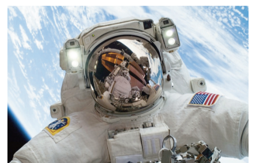
Rəqəmsal kamera, kameralı mobil telefon və ya planşet ilə çəkilən avto-portret növü

yaşayan xalq. Soldan sağa: 1.Doktorluq dissertasiyası hazırlamaq üçün bir elmi idarəyə təhkim olunmuş alim; 5.Bolqarıstanın şimalında çay; 7.Qiymətli kağızlar bazarında satın alınmış səhmlərin dəyərinin ödənişinin növbəti hesablaşma dövrünə qədər təxirə salınması imkanı; 8.Türk mifologiyasında korlar tanrısı ( xan ); 10.Yaponiyanın Tokiodan sonra ikinci böyük şəhəri; 11.İranda duzlu göl; 12.XIX əsr görkəmli Azərbaycan şairi; 14.Yağda qovrulmuş un və doşabdan, bəzən də baldan, şəkərdən bişirilən Şərq şirniyyatı; 19.Uzaq Şərqdə çay; 21.Rəqəmsal kamera, kameralı mobil telefon və ya planşet ilə çəkilən avto-portret növü; 22.Sahibinə hər hansı müəssisənin aktivlərində müəyyən bir paya sahiblik və payına uyğun olaraq müəssisənin gəlirinin