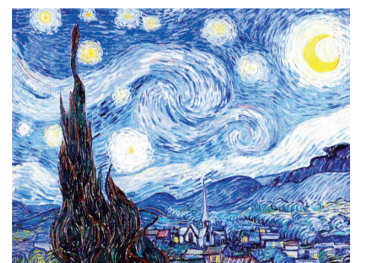
Holland rəssamının məşhur «Ulduzlu gecə»-si. 1889.

tilik qazanxanası sistemlərində su qızdırıcılarının ümumi adı; 20.Quba və Xaçmaz rayonlarının ərazisindən axaraq Xəzər dənizinə tökülən çay; 21.Müxtəlif vaxtlarda Britaniya imperiyasına daxil olan bir sıra ölkələrin, o cümlədən Finlandiya və Estoniyanın xırda pul vahidi. Soldan sağa: 1.Karbonat sinfinə aid olan mineral (suxur); 5.Məşhur holland rəssamı. Postimpressionizm cərəyanının nümayəndəsi; 7.Çalğı aletlərini, habelə xor oxuyarkən səsindən əsas ton kimi istifadə edilən, bərk cisimə toxundurulduqda müəyyən yüksəklikdə səs çıxaran kiçik polad alet; 8.Gürcüstanda yaşayan müsəlman etnik qrup; 10.İri ticarət mərkəzinin adı; 11.Türkiyədə şəhər; 12.Qədim yunan şairi. Monodik melikanın ən görkəmli nümayəndələrindən biri; 14.Xüsusi, ayrıca buraxılış üzrə yerləşdirilən qiymətli kağızlar, istiqrazlar seriyası; 19.«Mən mahnı qoşuram» filmində (1979) Sonanın anasının obrazını oy-