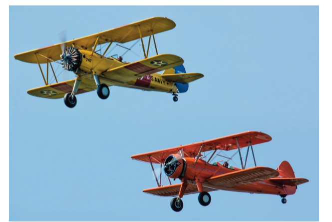
Qanadları üst-üstə yerləşdirilmiş ikiqanadlı təyyarə

hərində yerləşən və 1998-2004-cü illərdə dünyanın ən hüdürlü tikilisi hesab olunan göydələnlər; 8. XIX əsrin sonunda ABŞ-ın cənub-şərqinin afroamerika icmasında yaradılmış musiqi janrı; 10. Rusiyanın Perm diyarından keçən çay; 11. Avstraliya İttifaqının gerbində təsvir olunmuş heyvanlardan biri; 12. «Qayınana» filmində Afət obrazını canlandıran aktrisanın adı; 14. Türk və Altay mifologiyalarında od tanrısı; 19. Yuxarıya doğru gətiricə itiləşən, piramida formalı ucu olan tili sütun; 21. Asiyada dövlət; 22. Azərbaycan xalqının soy-kökündə əsas yer tutan türk tayfalarından biri. Respublikamızda rayon; 23. Mövsümi sitrus meyvəsi; 24. Misir firo-