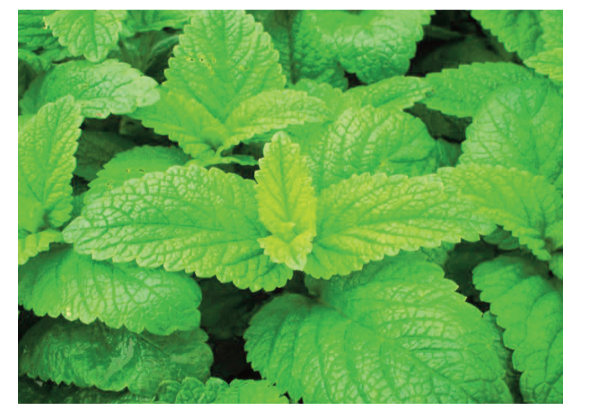
Ballınanə, limonotu adları ilə tanınan ot bitkisi

maz rayonları ərazisindən axan çay; 5.1919-cu ildə Versal müqaviləsi əsasında yaradılmış ömək münasibətlərini tənzim edən qurum; 7.Türkiyədə oriyental tipli xalq musiqisi janrı; 8.İtalyan aktrisasının soyadı. «İnadkarn ram edilməsi» filminin baş qəhrəmanlarından biri; 10.Bir idarə və ya müəssisənin tapşırığı və vəkaləti ilə iş görən adam, müvəkkil; 11.ABŞ-ın 20-ci prezidentinin soyadı; 12.İtaliyada kabus şəhər; 14.Mövsumi meyvə; 19.Dalmazkimilər fəsiləsinin bədrənc cinsindən olan çoxillik ot bitkisi (ballınanə, limonotu adları ilə də tanınır); 21.Müəllifin bilavasitə gördüyü, şahidi olduğu real faktlardan, hadisələrdən, adamlardan bəhs olunan kiçik ədəbi əsər; 22.Həndəsi fiqur; 23.Böyük musiqi-vokal əsərinin (opera, operetta, oratoriya) mətni; 24.1997-2001-ci