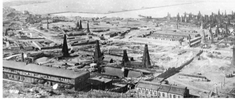
Bakı şəhərində neft mədənləri