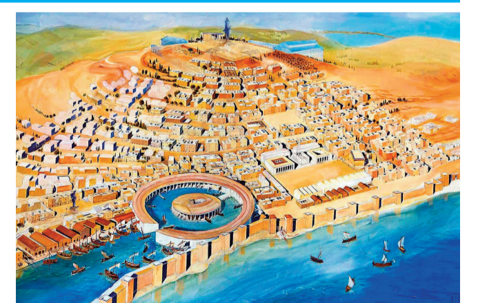
Şimali Afrikada əsas Finikiyanın Tir şəhərindən gəlmiş kolonistlər tərəfindən qoyulmuş qədim dövlət

təsirlənən əsas nitq hissəsi; 7.Şimali Afrikada əsas Finikiyanın Tir şəhərindən gəlmiş kolonistlər tərəfindən qoyulmuş qədim dövlət; 8.Azərbaycan yazıçısı, ssenarist, şair, tərcüməçi; 10.Bolqarıstanın qədim şəhər; 11.Türkiyənin ilk prezidenti, görkəmli dövlət xadimi, milli lider; 12.Müxtəlif ölçü və biçimdə olan mətbəə hürufatı; 14.Bağ, park və xiyabənlərdə dekorativ və s. məqsədlə ot əkilmiş meyvədança; 19.Ukraynada kabus şəhər; 21.Azərbaycanın məşhur estrada müğənnisinin adı; 22.Müntəzəmlik; 23.ABŞ-da ştat; 24.Sahə ölçü vahidi (4046,86 kv.m.); 25.Riyazi proqramlaşdırmanın ümumi məsələsi, müəyyən