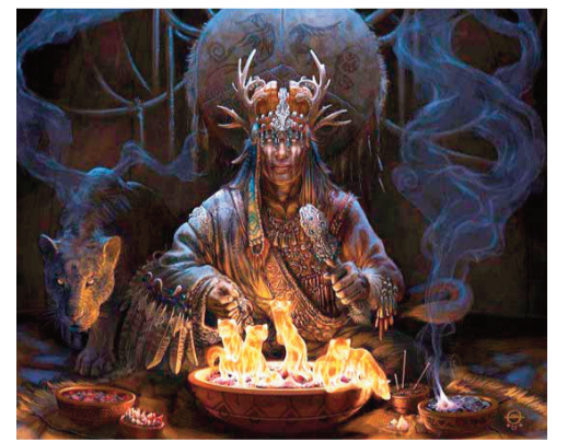
Magiyaya inanan xalqlarda (əsasən, şimal xalqlarında) sehrbaz, ovsunçu, cadugər

kelt tayfası və bu tayfanın nümayəndəsi. Soldan sağa: 1. Başqasının əsərini öz əsəri kimi verən və ya müəllifi göstərmədən başqasının əsərindən istifadə edən şəxs; 5. Bir çox Şərqi ölkələrində hökmdar titulu; 7. Natiqlik nəzəriyyəsi, natiqlik sənəti haqqında elm; 8. Müsəlmanlarda camaat namazına başçılıq edən, habelə bir məhəllədə nikah, ölüm və s. dini işlərə baxan ruhani; 10. İslam dinində əldə edilmiş mal və pulun halallığını təmin etməkdən ötrü onun dini ehtiyacları və fəqir-füqərəyə verilmək üçün ayrılan hissəsi (dini vergi); 11. Duza və sirkəyə qoyulmuş tərəvəz, şoraba, tutma; 12. Böyük Britaniyada çay; 14. Fransız çərəyi; 19. Qiymətli mineral daş. Astmaya, rəvmatizmə, diş ağrısına, zəhərlənmələrə, yaraların sağalmasına kömək edən sağlamlıq daşı; 21. E.ə. II minilliyin əvvəllərində Mesopotamiyada mövcud olmuş şəhər-dövlət; 22. Həzm kanalının ən geniş hissəsini təşkil edən orqan; 23. Ellinizmin və Roma fəlsəfəsinin mühüm cərəyanı-