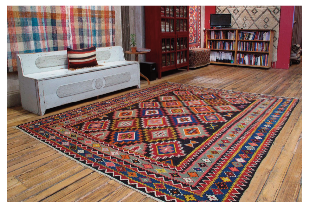
Yundan və ya pambıqdan toxunan xovsuz xalça növü

rin əvvəllərində iki futbol klubunun birləşməsindən əmələ gələn yeni futbol klubunun adı; 20.Yundan və ya pambıqdan toxunan xovsuz xalça növü; 21.Qara dəniz sahilində kurort-qəsəbə (Gürüstən). Soldan sağa: 1.Naxçıvan şəhərinin cənub-şərqi, Araz çayı sahilində yerləşən hərbi istehkam tipli qala; 5.Xalq arasında yayılmış adət, ənənə; 7.Nikbinlik; 8.Cəlilabad rayonunda kənd; 10.Xanəndə, Azərbaycanın xalq artistinin adı (1934-2008); 11.ABŞ-da ştat; 12.Karotin, C vitamini, şəkər, üzvi turşular və pektin maddələrlə zəngin olan bitki; 14.Xörək hazırlayan usta; 19.ABŞ kinorejissoru və prodüserinin soyadı. «Xaç atası» filminin ssenaristi; 21.RF-nin Lipetsk vilayətində şəhər;