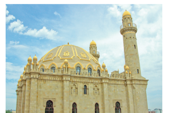
Abşeron ərazisində yerləşən məscid

Soldan sağa: 1.Dağıstan Respublikasının paytaxtı; 5.Rusiya Federasiyasının Perm vilayəti ərazisində çay; 7.Yunanistanın ikinci böyük şəhəri; 8.Yanma zamanı çıxan od; 10.Rusiya Federasiyasının Sverdlovsk vilayəti ərazisində çay; 11.Abşeron ərazisində yerləşən, bütün Şərqdə nadir gözəlliyi ilə diqqəti cəlb edən, yaş bir əsrdən çox olan məscid; 12.Türk mifologiyasında od tanrısı (xan); 14.Moskvanın mərkəzində tarixi kompleks; 19.Kişi adı; 21.Yazıçı, nasir, tərcüməçi, geologiya-mineralogiya elmləri namizədi (1942), dosent, əməkdar mədəniyyət xadimi. «Firtına», «Zirvələrdə», «Dağlar qoynunda» və s. əsərlərin müəllifinin adı; 22.Azərbaycanla qonşu dövlət; 23.Kəskin boğucu iyi olan dezinfeksiya maddəsi; 24.Qohumluq dərəcəsi; 25.Egey dənizin cənub-şərqində, Yunanıstana məxsus arxipelag. Tərcümədə lon iki ada» mənasını verir.