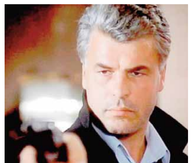
Mikele Plaçidonun «Sprut» serialında canlandırdığı obraz

infeksion xəstəliyi; 9.ABŞ-da ştat; 10.Binanın daxilində üst örtüsü; 11.Mikele Plaçidonun «Sprut» serialında canlandırdığı obraz; 12.Roma siyasi və hərbi xadimi; 14.Üst paltar üçün naaxışlı yun parça; 19.Müstəqil dövlət-şəhər və Roma katolik kilsəsinin mərkəzi; 21.RF-nin Komi Respublikasının göl; 22.Şərqsünas, tarixçi, Sovet İttifaqı Qəhrəmanı, əməkdar elm xadiminin adı; 23.Pyeslər, səyahətnamələr, romanlar və şeirlər də yazmasına baxmayaraq, daha çox nağıllarına görə tanınan danimarkalı ədib; 24.Ölkəmizdə fəaliyyət göstərən informasiya agentliklərindən biri; 25.Kosmik aparatlar üçün liman.