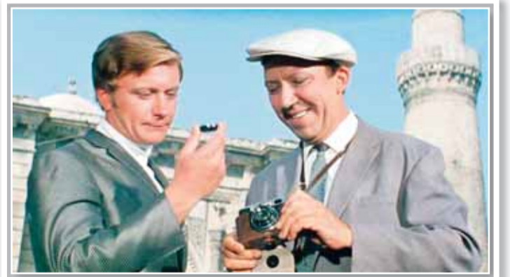
«Brilyant əl» filmindən epizod

yişən, rəngli naxışlar göstərən, boruşkilli optik cihaz (oyuncaq); 8.Uduşları dərhal ödənilən lotereya; 9.Müəssisənin sahib olduğu bütün maddi mülkiyyəti əhatə edən anlayış, mühasibat termini; 10.Neftin fraksiyası; 11.Aralıq dənizi hövzəsində cənub və cənub-şərq istiqamətində əsən güclü, isti külək; 12.Üst paltar üçün naxışlı yun parça; 14.İdarə və müəssisələrin rəsmi nişanı; 19.Evkommiya cinsinə aid bitki növü (ağac); 21.1490-1574-cü illərdə Hindistanda hakimiyyətdə olmuş seltənət; 22.Fransız əsilli postimpressionist rəssam; 23.Rusiya və Sovet kinorejissoru, ssenarist, aktyor, prodüser və şairi. «Həmi-