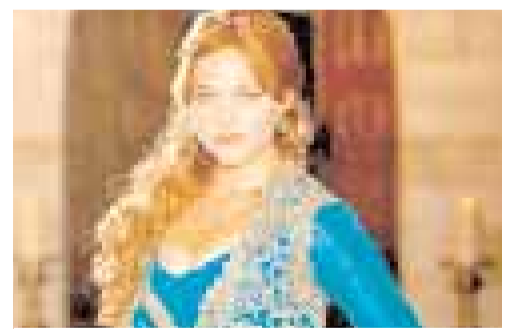
«Möhəşəm yüz il» filmindən epizod

da və ya üstündə ucalan qüllə, qadın adı; 18.Bir şeyi əldə etmək, yaxud bir işi həyata keçirmək üçün lazım olan şey, üsul, yol, alət və s.; 20.Pişiklər fəsiləsinin panter cinsinə aid heyvan növü; 21.İnsanın könüllü surətdə, məcbur edilmədən məşğul olduğu və böyük zövq aldığı fəaliyyət. Soldan sağa: 1.«Alma almaya bənzer» filmində (1975) baş qəhrəman - Nadir baba obrazını canlandıran aktyorun adı; 5.Ölkəmizdə ali təhsil müəssisəsinin qısaltılmış adı; 7.Şərab növü; 8.Müsəlmanlarda camaat namazına başçılıq edən, habelə bir məhəllədə nikah, ölüm və s. dini işlərə baxan ruhani; 10.Yazıçı, publisist, geneoloq, Avrasiya Yazıçılar, Azərbaycan Jurnalistlər birliklərinin, Azərbaycan Tarixi Şəcərə cəmiyyətinin üzvünün adı; 11.Yunan filosofu, neoplatonizmin sələfi; 12.«Səhər» filmində (1960) Miral obrazını canlandıran aktyorun adı; 14.Krit adasında qədim şəhər; 19.Ayaq üçün nəzərdə