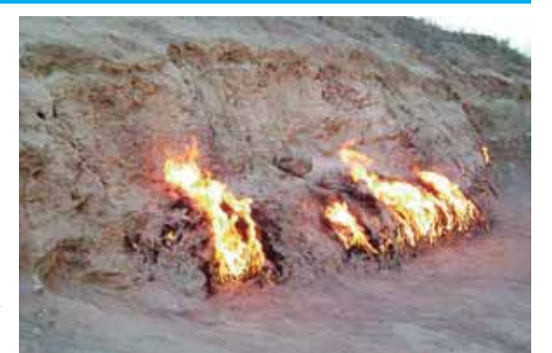
Bakı şəhəri yaxınlığında təbii qazın çıxması nəticəsində alovlanan, tarixi bilinməyən təbiət abidəsi

aşırım» povestinin qəhrəmanlarından biri, «Qırımı tabor»un komandiri; 5.Mərkəzi Afrikada dövlət; 7.Bakı şəhəri yaxınlığında təbii qazın çıxması nəticəsində alovlanan, tarixi bilinməyən təbiət abidəsi; 8.Döş qəfəsində yerləşən əzələvi üzv; 10.Türk və monqollarda nəslitayfa birliyi forması; 11.Uzun müddət ərzində iki mümkün dayanıqlı tarazlıq vəziyyətindən birində olan və xarici idarəedici siqnalın təsiri ilə sıcaqla bir vəziyyətdən digərinə keçə bilən qurğu; 12.Almaniya şəhəri (Bavariya); 14.Culfa rayonunda kənd; 19.Böyük göllər qrupuna daxil olan göl (ABŞ-da yerləşir); 21.Ölkəmizdə və Yaxın Şərqdə geniş yayılmış şirniyyat növü; 22.Misin qalay, alüminium, berillium