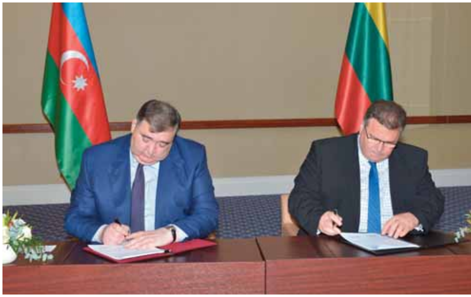
İclasın yekunlarına dair Protokolu Komissiyanın həmsədrəri - Azərbaycan Respublikasının vergilər naziri Fazil Məmmədov və Litva Respublikasının xarici işlər naziri Linas Linkyaviçyus imzalayıblar

İclasın sonunda Azərbaycan ilə Litva arasında ikitərəfli əməkdaşlıq üzrə Hökumətlərarası Komissiyanın 5-ci iclasının yekunlarına dair Protokolu imzalanıb. Sənədi Komissiyanın həmsədrəri - Azərbaycan Respublikasının vergilər naziri Fazil Məmmədov və Litva Respublikasının xarici işlər naziri Linas Linkyaviçyus imzalayıblar.