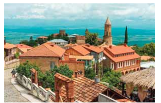
Gürcüstanın şərqi-də dağ əyində yerləşən, turistlər arasında populyar olan tarixi qəsr və eyniadlı şəhərcik

21.Yayın axırında qırılan qoyun yunu. Soldan sağa: 1.Vokal və ya instrumental melodiya; 5.Danışq vaxtı telefon dəstəyi ələ götürüldükdə söylənilən ilk söz; 7.Fransa mənşəli bal rəqsi; 8.Sakit okeanın cənub hissəsində yerləşən ada-dövlət; 10.Bankın və ya sahibkarın borc iltizamlarını vaxtında ödəyə bilməməsi nəticəsində fəaliyyət göstərən bilməməsi; 11.Gürcüstanın şərqi-də dağ əyində yerləşən, turistlər arasında populyar olan tarixi qəsr və eyniadlı şəhərcik; 12.Mədəxilə məxaric arasındakı fərq, qalıq; 14.İttiham olunan şəxsin cinayət əməlinə iştirakının olmadığını sübut edən anlayış, hüquqi termin; 19.Yaponiyada prefektura; 21.Azərbaycanın tarixi ərazisi olan Zəngə-