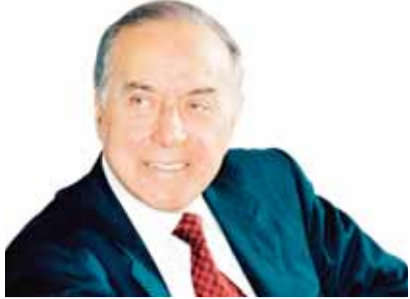
Biz bazar iqtisadiyyatını vergi yolu ilə tənzimləməliyik.