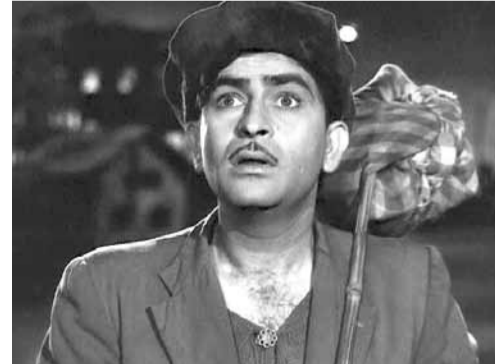
«Avara» filmindən epizod

Soldan sağa: 1.Mübadilə fəaliyyətini həyata keçirmək üçün bazarda aparılan məqsədyönlü fəaliyyət; 5.Zirehli texnika əleyhinə qumbaraatan; 7.Yevlax rayonunda kənd; 8.Rusiya dağ çay; 10.Türk dilində ilin 5-ci ayının adı; Türkiyə təqvimində ilin 5-ci ayının adı; 11.Neptunun üçüncü ən böyük peyki; 12.Müasir döyüş sənəti, idman növü; 14.Respublikamızda rayon; 19.Aypara şəkli olan içi ətli italyan piroqu; 21.Cənubi slavyan xalqlarında simli, kamanlı çalğı aləti; 22.Piriney yarımadasında ən böyük çay; 23.Bor tərkipli alüminatlı qrupundan mineral (qırmızı, bənövşəyi, çəhrayı, göy, yaşıl və s. rənglərdə olur) zinəət əşyalarının istehsalında geniş istifadə olunan qiymətli daş; 24.Məşhur hind kinorejssoru, ssenarist, prodüser