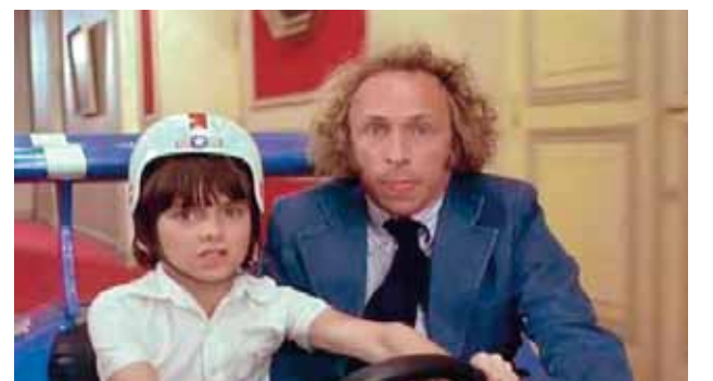
Baş rolda Pyer Rişar olmaqla Fransa rejissoru Fransua Veberin komediya filmindən epizod

Soldan sağa: 1.Pedaqogikamın təlim və tərbiyə üsullarından bəhs edən söhbət; 5.İlin dördü - bir hissəsi; 7.İki samitin qovuşmasından yaranan yeni samit; məs.: rusca «L» (t+s), «Ç» (t+s); 8.Xəstəlik və ya qocalıq nəticəsində ömək qabiliyyətini itirmiş şəxs (şikəst); 10.RF-nin Xabarovsk vilayətində çay; 11.Azərbaycanda rusdilli sayt (əvvəllər gündəlik ictimai-siyasi qəzet kimi fəaliyyət göstərmiş); 12.Azərbaycan dramaturqu C.Cabbarlıın pyesi; 14.Kimyəvi element (qaz); 19.Çobanyastığıkimilər fəsiləsinə aid bitki cinsi; 21.Boliviyada çay; 22.İndoneziyanın