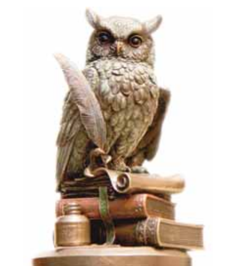
Qədim yunan mifologiyasında bilik və müdriqliyin rəmzi olan quş. «Nə? Harada? Nə zaman?» intellektual oyununun simvolu

Soldan sağa: 1.Six, nazik ipək parça; 5.Həndəsi fiqur; 7.Alazan vadisində (Gürcüstan) şəhər; 8.Kişi adı; 10.Argentinada səhra; 11.Hindistanda şəhər. Uttar Pradeş ştatının mərkəzi; 12.Quba rayonunda kənd; 14.İşıqlandırıcı, yandıran. Azərbaycanda qız adı; 19.Kofe bişirmək üzrə mütəxəssis (kofe üzrə barmen); 21.Səhər hava işıqlanan və ya axşam hava qaralmağa başlayan vaxt, alqaranlıq; 22.Azərbaycan bəstəkarının adı; 23.Belarusda şəhər; 24.RF-nin Tomsk vilayətində çay; 25.Entuziazm - Böyük şövq, həvəs, vəcd.