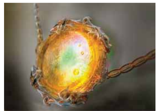
Bəzi xalqların inanclarına görə bədnəzərdən qoruyan, xoşbəxtlik və müvəffəqiyyət gətirən sehrli əşya

qoruyan, xoşbəxtlik və müvəffəqiyyət gətirən sehrli əşya (amulet); 8.İranın Qərbində qədim Azərbaycan şəhəri; 10.Gülçiçəyikimilər fəsiləsinə aid bitki cinsi (meyvə); 11.Latviyanın şimal-şərqində eyniadlı gölün sahilində yerləşən şəhər; 12.Türk mifologiyasında əjdaha, Türkiyədə populyar kişi adı; 14.Dekorasiya və ya istilik yaratmaq məqsədi ilə divara vurulan və ya döşəməyə salınan müxtəlif rəngli yun və ya iplik saplardan toxunmuş naxışlı əşya; 19.Aralıq dənizi hövzəsində cənub və cənub-şərq istiqamətində əsən güclü, isti külək; 21.Yaxın və Orta Şərq ədəbiyyatında əsərlərin əlifba sırasına əsasən düzülüyü şeirlər məcmuəsi; 22.İspaniyada şəhər; 23.Düzəngah ərazi. Səfəvi və Osmanlı dövlətləri arasında 23 avqust 1514-cü ildə baş vermiş döyüş bu ərazinin adı ilə adlandırılır; 24.At, qatır və s. heyvanların dirnaqlarına sürüş-