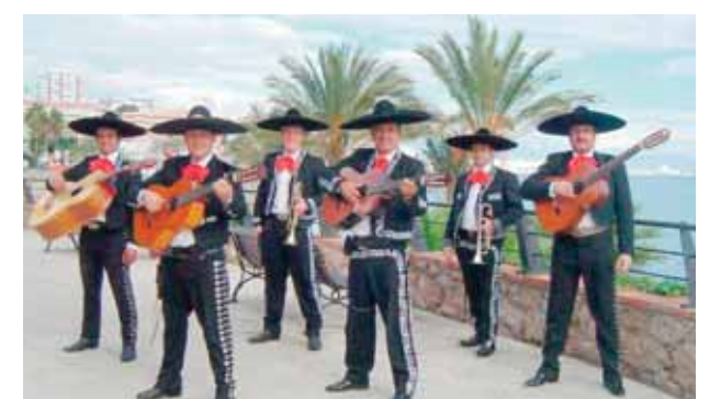
Latin Amerikas, İspaniya və ABŞ-in cənub-qərb regionlarında məşhurlaşmış meksikalıların xalq musiqisi janrı

Soldan sağa: 1.Adı Nizami Gəncəvinin «Sirlər xəzinəsi» əsərində çəkilmiş İran padşahı; 5.Kalsiumla zəngin qida məhsulu; 7.Vahid mərkəzə idarə edilən, vahid kommunada idarə olunan aparılan inqilabi hərəkət və həmin hərəkətin üzvü; 8.Qayıqçı küreyi; 10.Aldatmaq məqsədi ilə deyilən əsilsiz söz; 11.Latin Amerikas, İspaniya və ABŞ-in cənub-qərb regionlarında məşhurlaşmış meksikalıların xalq musiqisi janrı; 12.Amerika ədəbiyyatında romantik cərəyanın yaradıcılarından olan yazıçılarından birinin adı; 14.Hindistanda və Şərqi bəzi başqa ölkələrində: əsil-nəsəbi, ata-baba peşələri və hüquqi vəziyyətləri cəhətdən bir-biri ilə bağlı olan qapalı ictimai qrup, təbəqə, silk; 19.Merhumun cəsədinin olma-