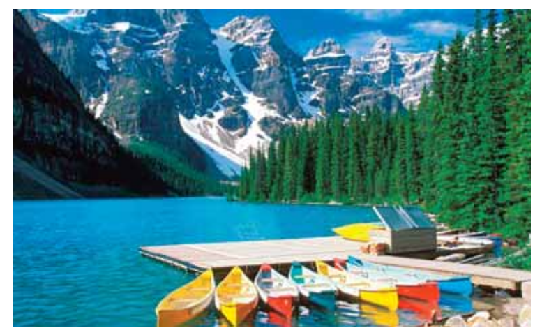
Kanadanın Banf Milli parkında buz gölü

Yuxarıdan aşağı: 1.Polşada şəhər; 2.Neptun planetinin peyki; 3.Gədəbəy rayonunda kənd; 4.Atlantik okeanında uçqar dəniz; 5.Misir ərazisində Nil çayı üzərində tikilən bənd; 6.Masallı rayonunda kənd; 9.«Qəbul olsun», «arzun yerinə yetsin» mənasında, adətən, duaların axırında söyülən; 13.Orta əsrlər fars ədəbiyyatının, qəzəl janrının ən görkəmli nümayəndələrindən biri; 15.Amerika və Uzaq Şərq ölkələrində çox məşhur olan idman növü; 16.Kiçik Asiyada antik şəhər; 17.Hindistanın məşhur siyasi xadiminin adı; 18.Kanadanın Banf Milli parkında buz gölü; 20.Qədim zamanlardan bu günümüzdə qədr istifadə edilən təxmini uzunluq ölçü vahidi; 21.Meyvə şirəsi ilə qənd qarışdırılaraq hazırlanan şəffaf kristal şirni növü. Soldan sağa: 1.Mədəniyyət əsərlərinin vəhşicəsinə dağıdılması, mədəniyyət düşmənciliyi; 5.Quran surələrinin müstəqil mənası olan cümlələrindən hər biri; 7.Respublikamızda rayon; 8.Rusiya Federasiyasında çay; 10.Qax rayonunda kənd, alimləri ilə məşhurdur; 11.Qiymətli kağızlarda, kağız pul nişanlarında, sikkələrdə göstərilən dəyər; 12.Suyun süxurları əritməsi, onlarda boşluqların və bunlarla əlaqədar yer səthində və dərinlikdə özünəməxsus relyef formalarının emələ gəlməsi hadisəsi; 14.Rusiya Federasiyasının Orlov vilayətində çay; 19.Uzaq Şərqdə liman şəhəri; 21.Sinir mənasını verən mürəkkəb sözlərin