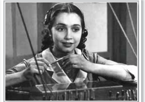
«Telefonçu qız» filminin baş qəhrəmanı

dizm məzhəblərindən biri; 3.Memarlıqda konus hissə, tağvari konstruksiya; 4.İspaniyanın şimalında çay; 5.Avstriyanın paytaxtı Vyana; 6.Avropada ən çox turist cəlb edən saray; 7.Azərbaycan dramaturqu C.Cabbarlının pyesi; 8.Qatıq şimal-qərbində şəhər; 9.Şimal-qərbində şəhər; 10.Şimal-qərbində şəhər; 11.Şimal-qərbində şəhər; 12.Şimal-qərbində şəhər; 13.Şimal-qərbində şəhər; 14.Şimal-qərbində şəhər; 15.Şimal-qərbində şəhər; 16.Şimal-qərbində şəhər; 17.Şimal-qərbində şəhər; 18.Şimal-qərbində şəhər; 19.Şimal-qərbində şəhər; 20.Şimal-qərbində şəhər; 21.Şimal-qərbində şəhər; 22.Şimal-qərbində şəhər; 23.Şimal-qərbində şəhər; 24.Şimal-qərbində şəhər; 25.Şimal-qərbində şəhər.